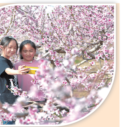
连日来,临夏县南塬乡张河西村的1000亩桃花竞相绽放,吸引不少游客前来踏青赏花。近年来,张河西村积极调整农业产业结构,探索“赏花+采摘+旅游”等多种农旅融合发展模式,促进农业增效、农民增收,助力乡村振兴。图为游客在桃园里拍照、赏花。