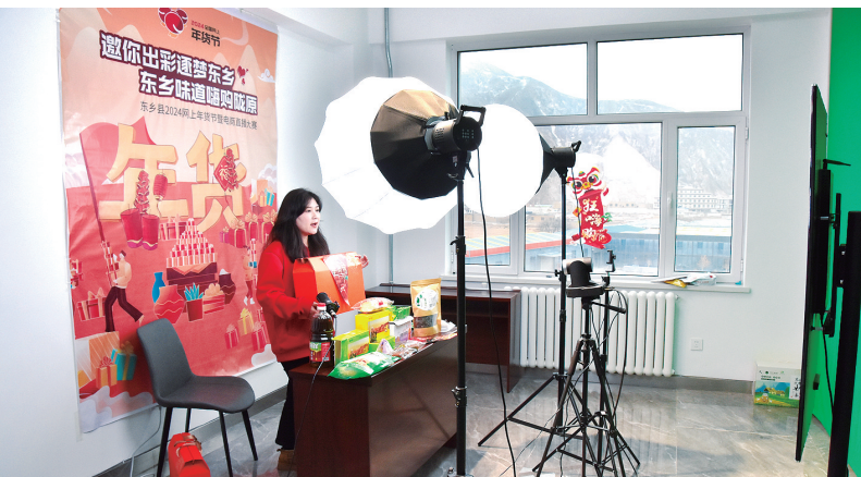
东乡县美食数字产业化基地自投入运营以来,挖掘和有效利用本地特色资源,引导电商企业建立特色网货品牌。目前,签约全省电商主播70多人,为电商企业输送电商化人才20多人,开展电商直播80多场次。图为电商主播正在直播售货。

工作人员详细介绍每台机具结构组成、工作原理以及操作性能,认真答疑解惑,并进行现场演示。通过此次投放活动,进一步引导群众认识到依靠先进农机技术提高春耕春播生产效率的重要性,推进全县农业机械化、智能化发展,助力乡村振兴。