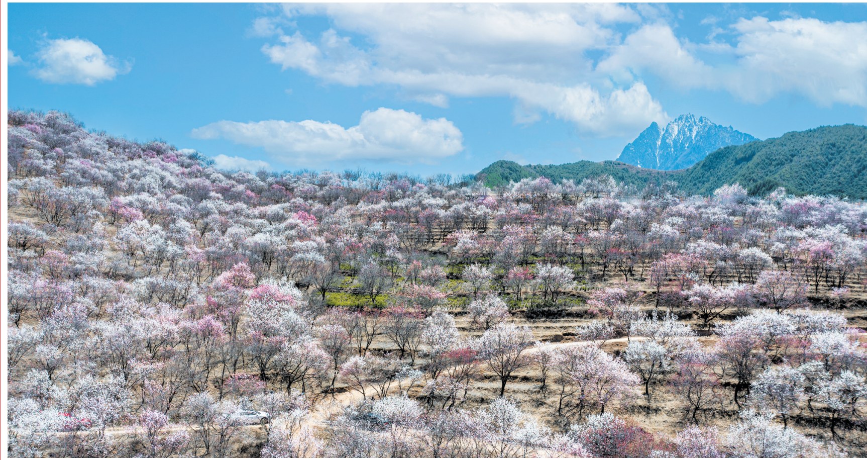
四月春风暖,吹得杏花开。近日,康乐县莲麓镇低寺坪村拉扎山的杏花灿然开放,一派春意盎然的新景象,为美丽春天增添了一抹别样的色彩。