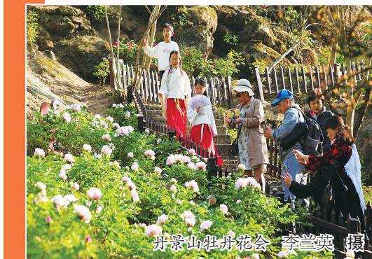
丹景山牡丹花会

从彭州城区沿着岷江河谷逆流而上,目之所及,景色犹如画卷般铺展。沃野千里、田园牧歌、高山河谷、森林雪山……这条长约60公里、面积超100平方公里的城市廊道一直延伸到龙门山,与大熊猫国家公园融为一体,回荡着立体山水的“彭派之声”。