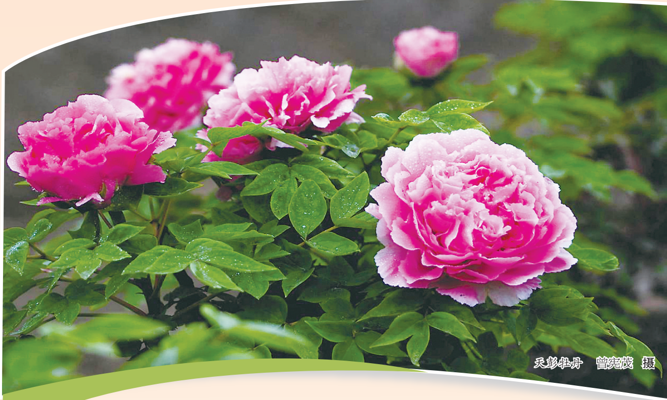
天彭牡丹