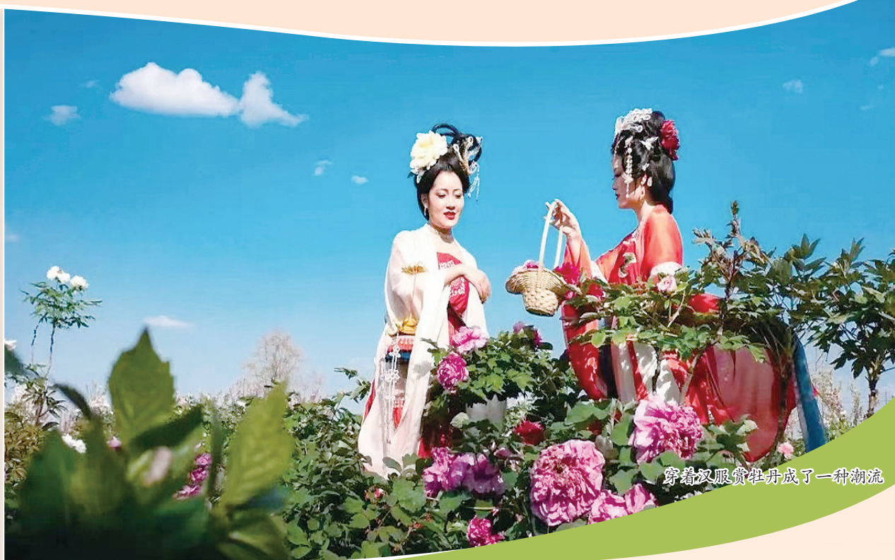
穿着汉服赏牡丹成了一种潮流

当流淌千年的灿烂文明凝聚成一株牡丹,会开出怎样绚烂的花朵?当“国花”牡丹遇上“国宝”大熊猫,会是怎样的奇妙体验?这个春天,那就到四川彭州看看吧。正值春意正浓时,第40届成都(彭州)天彭牡丹花会暨牡丹文化季已拉开帷幕。得益于大自然的钟灵毓秀,灿烂辉煌的历史传承,这里与大部分中原牡丹名城有着完全不同的别样韵味。