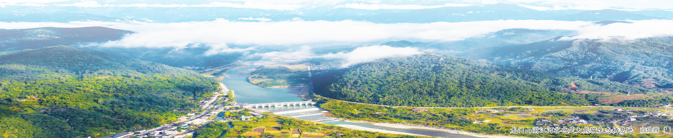
龙门山岷江河谷也是大熊猫生态栖息地