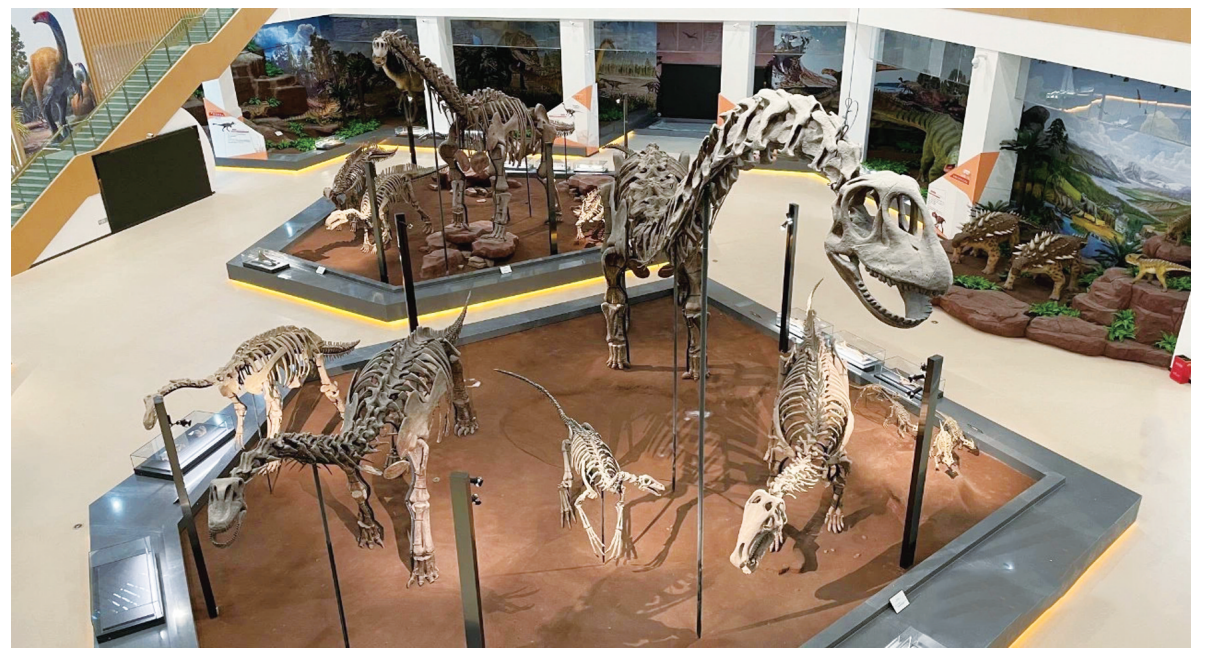
刘家峡恐龙国家地质公园

刘家峡恐龙足印化石群于1999年8月被甘肃省地质专家首次发现,2001年12月被原国土资源部批准命名为甘肃刘家峡恐龙国家地质公园。该区域内的主要地质遗迹为成群的早白垩纪恐龙足迹化石群。截至目前,景区内共发现足迹点10个,人工揭露4个,揭露面积为2800平方米,共有11类150组1831个足迹。其足迹化石产出层位之多、清晰度之好、分异度之高,为世界罕见。足迹群以兽脚类恐龙、蜥脚类恐龙、鸟脚类恐龙、翼龙和鸟类足迹最具代表性,是中国最重要的足迹化石之一。在同一地点出现如此多样的植食类和肉食类恐龙足迹,在国内外实属独一无二。更为奇特的是,与恐龙足迹共生的还有翼龙类和龟鳖类足迹,其中保存于1号点保护馆内的翼龙类足迹包含24枚连续的、长5米的前后足迹,是目前世界上保存最好和最长的翼龙类足迹。