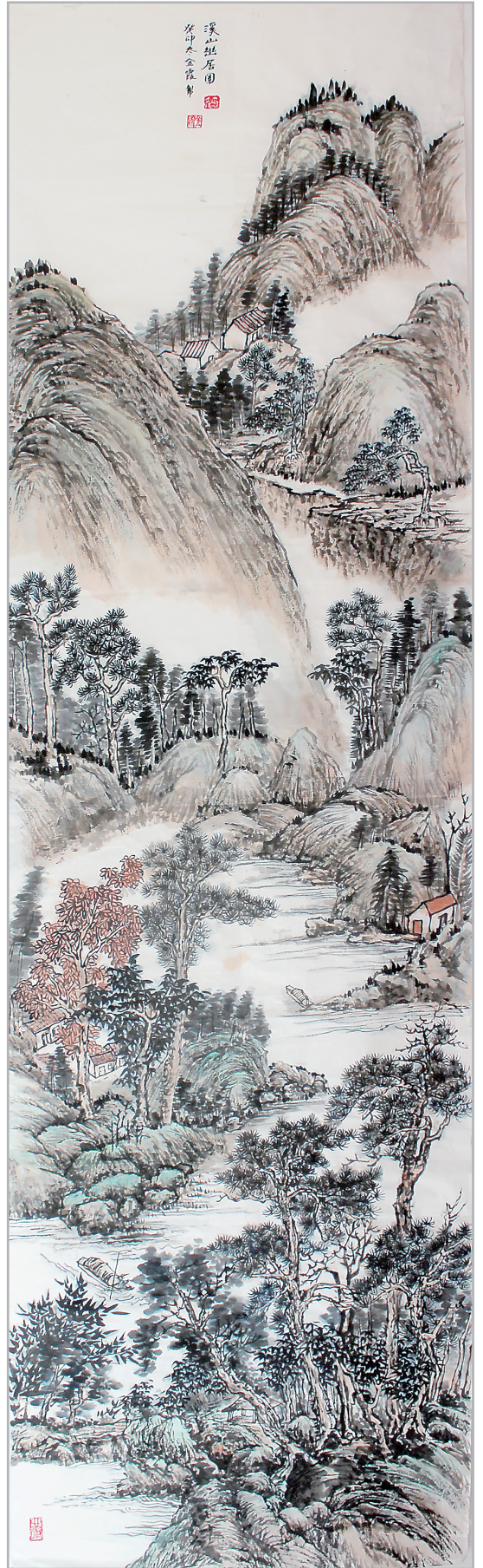
溪山幽居圖 管金霞