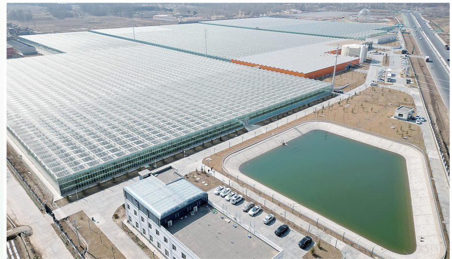
临夏百益亿农国际鲜花港