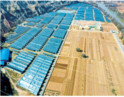
眼下,正值春耕备耕关键期,东乡县唐汪镇利用设施农业优势,抢抓农时,全力以赴为今年农业生产开好头、起好步。

近日,记者走进该镇白咀村“农光互补”项目基地,放眼望去,一座座温室大棚首尾相接排列在田野上。大棚内,一丛丛西红柿、辣椒等幼苗长势喜人,管理人员忙着整地、打底肥、起垄、上膜,各项工作井然有序。