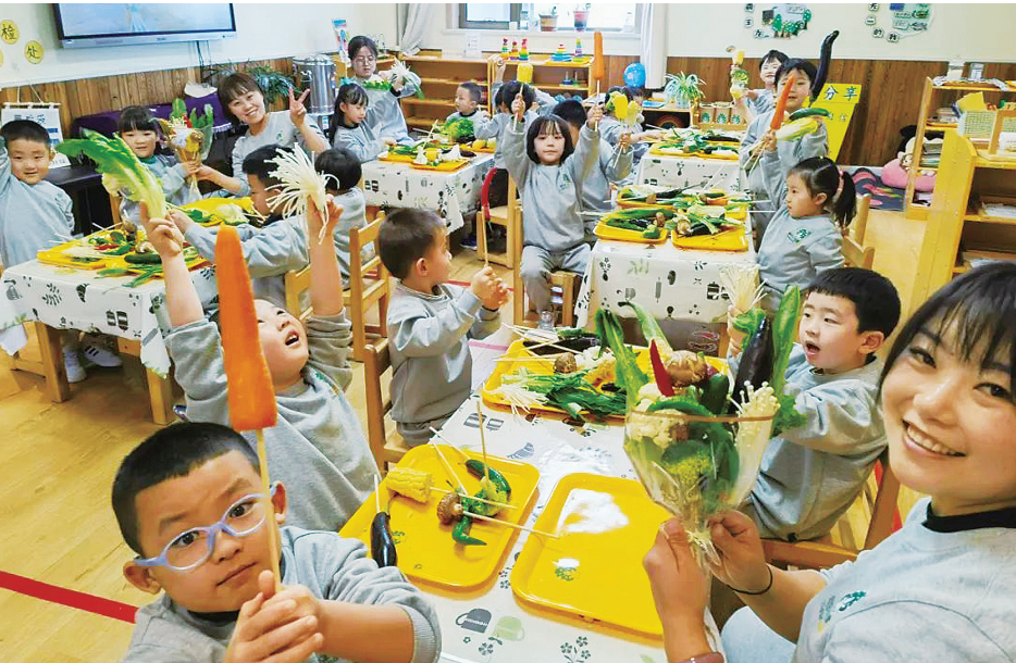
近日,临夏市城北街道东郊社区、中天健社区、东校场社区联合新世纪晨光幼儿园,开展“春生万物 识绿先行”青春绽放“小红星”公益课堂,邀请小朋友们用喜欢的蔬菜制作“蔬菜鲜花”,以别样角度感受蔬菜之美。