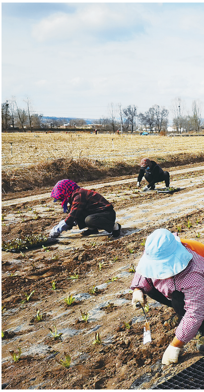
今年,临夏县充分利用适宜发展高原夏菜和设施农业的优势,聚焦农业产业结构调整,不断培育壮大主导产业。图为先锋乡卢马村高原夏菜种植基地内,群众在种植红苜蓿。