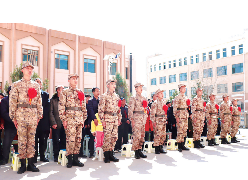
近日,东乡县举办2024年新兵欢送大会,10名入伍新兵进行役前训练成果演练展示。新兵们表示,将刻苦训练、服从命令、听从指挥,做新时期优秀军人,为家乡争光添彩。

个方面情况进行检查,随机抽样检查食材,严防“三无”食品流入校园。还检查了校园周边食品经营单位是否无证无照经营、有无售卖“三无食品”、超过保质期食品、变质食品及不符合食品安全标准食品等,督促负责人把好溯源关和质量安全关。