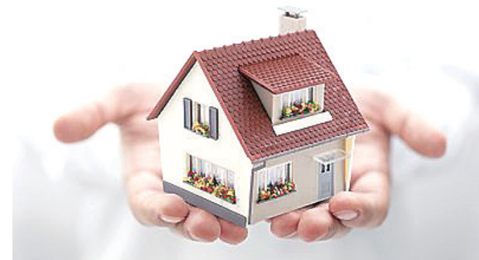
今年的政府工作报告提出，适应新型城镇化发展趋势和房地产市场供求关系变化，加快构建房地产发展新模式。