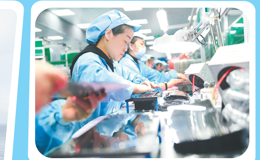
2月18日,工人在位于重庆市北碚区的一家微电路企业生产线上忙碌。2月18日是春节假期后第一个工作日,各地企业纷纷开工生产,生产一线一派热火朝天的繁忙景象。