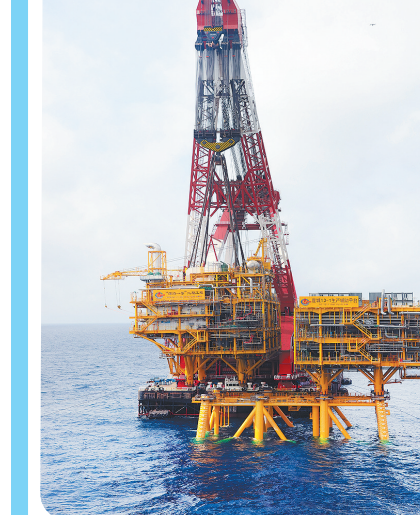
▲这是“深海一号”二期工程综合处理平台东西组块吊装现场(2月18日摄)。

据气象部门预测,2月17日至22日,受新一轮寒潮天气影响,我国中东部地区将有剧烈降温和大范围雨雪天气。针对本轮寒潮天气防范应对工作,交通运输部对新疆、山西、山东、河南、湖北、湖南、贵州、陕西8个预计受寒潮大风影响较重的省份逐一进行调度部署,要求全力做好寒潮天气防范应对、春运服务保障、安全生产、保通保畅等工作,切实做好恶劣天气预报预警和防范应对工作,切实加强重大风险防范和安全监管,确保人民群众平安便捷温馨出行,确保重点物资运输高效顺畅。