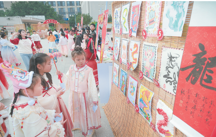
2月18日,小朋友在活动中为同学们设计的龙年邮票进行投票。当日,为迎接新学期开学,福州晋安区实验小学开展寓教于乐的“寻龙记”项目化学习活动,让同学们在游戏中体验传统文化的魅力。

两部门发布的通知明确,自2024年4月1日起执行至2025年3月31日,对注册登记在中国(上海)自由贸易试验区及临港新片区的企业开展离岸贸易,为支持自贸试验区发展离岸贸易,将在中国(上海)自由贸易试验区及临港新片区试点离岸贸易印花优惠政策。