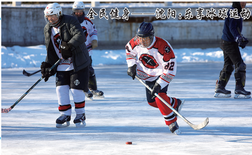
全民健身——沈阳:乐享冰球运动