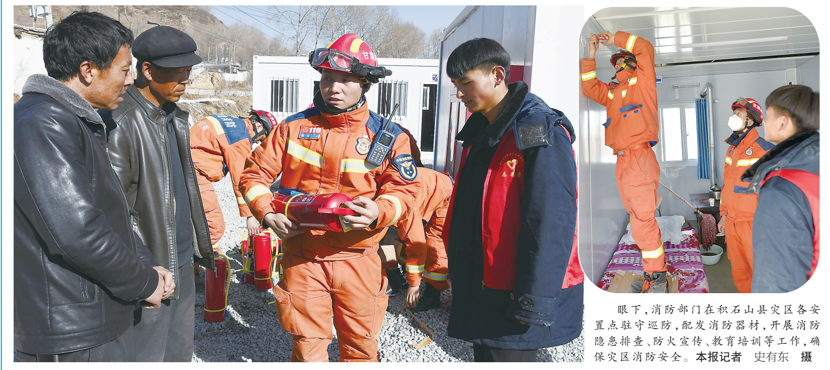
眼下,消防部门在积石山县灾区各安置点驻守巡防,配发消防器材,开展消防隐患排查、防火宣传、教育培训等工作,确保灾区消防安全。

更生,早点建好自己的家园。”如今,该安置点32间活动板房已全部入住,所有群众生活步入正轨。而每天一大早,张哈克木挨家检查群众生活、消防安全,督促搞好环境卫生。“我是党员,理应冲在前面。现在,群众安顿好了,我们会继续鼓励大家重拾信心、振作精神,重建美好家园。”张哈克木说。