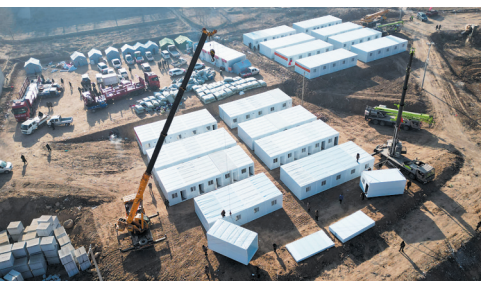
积石山县大河家镇康吊村安置点搭建板房。