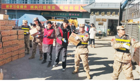
志愿者和民兵在卸载救援物资。