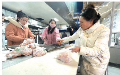
餐饮业员工正在加班加点打包鸡蛋准备送往灾区

州、县各餐饮企业充分发扬“一方有难 八方支援”的抗震救灾精神,全力投入救灾。记者在县城歇麻滩镇采访时,看到爱心企业帮助受灾困难群众免费发放食物的善举深受感动。