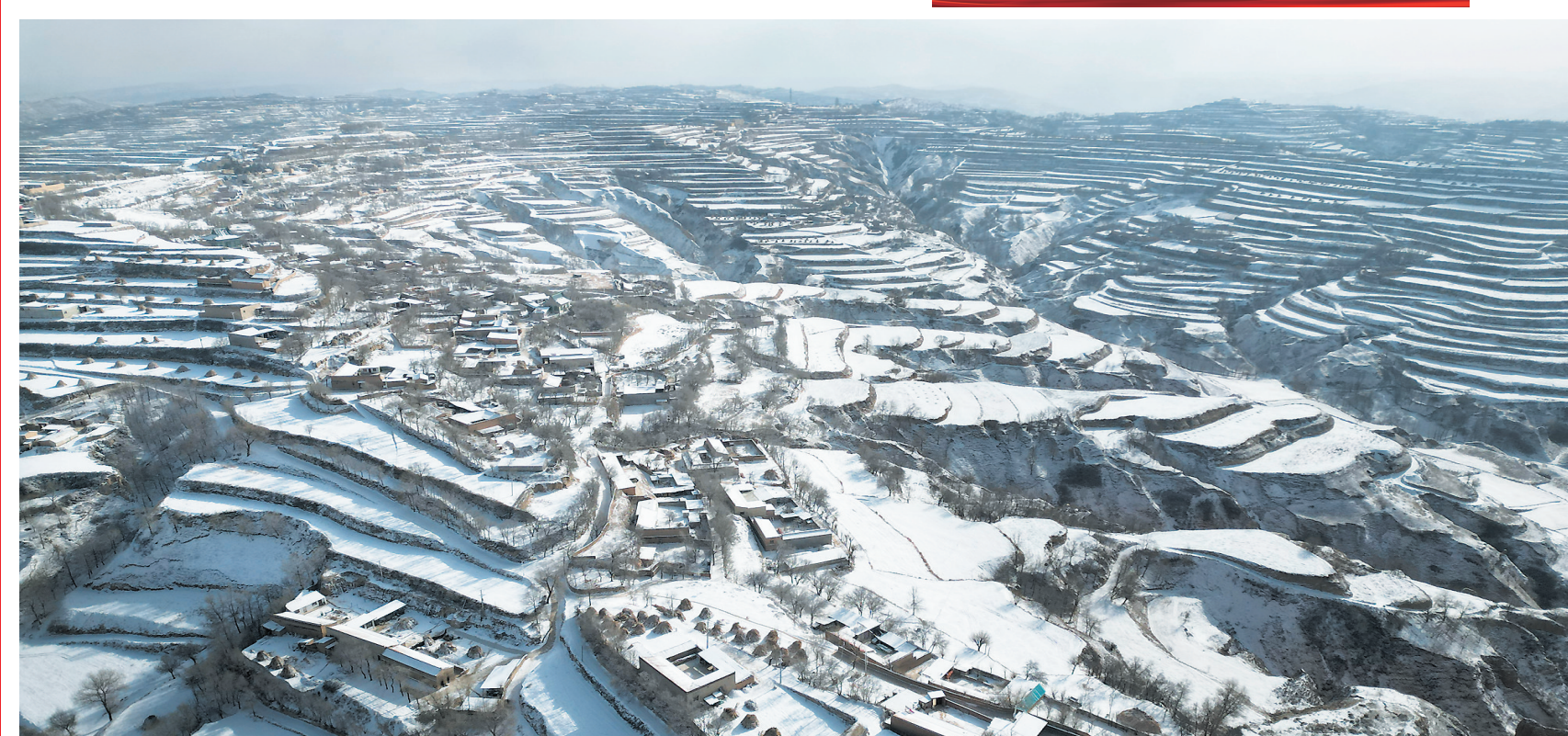
12月15日,东乡县迎来降雪天气,雪后的乡村、梯田、公路银装素裹,美如画卷。