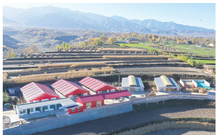
积石山县寨子沟麻沟村富民产业农民专业合作社牛养殖场占地10亩,建成标准化牛棚5座。今年,该养殖场存栏140头,出栏15头,累计给群众分红15万元,有效助力群众增收。

究所艺委会委员、临夏州拔尖人才、甘肃省敦煌文艺奖获得者、临夏州人才奖获得者。其作品入选全国各类展览100余次,获奖30余次,入选全国第十二届书法篆刻展(楷、行书)、“林散之双年展”全国书法作品展、“八大山人”全国书法作品展、第四届“文质兼美”全国优秀基层书法作品展览,获中国书坛中青年书法“百强榜”百强、中国书协培训中心教学成果展前50名、全国扇面信札书法艺术作品展提名奖、甘肃省第七届“张芝奖”书法大展一等奖、“青年书法奖”等。