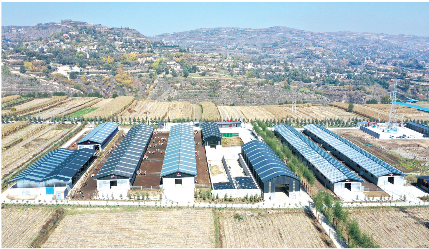
临夏县新集镇甘肃旭昊泽农牧发展有限公司占地80亩,修建标准化牛棚6栋。目前,该公司存栏牛1100多头,年可繁育犊牛500多头,吸纳当地群众就业和季节性用工500多人,有效助力群众增收。