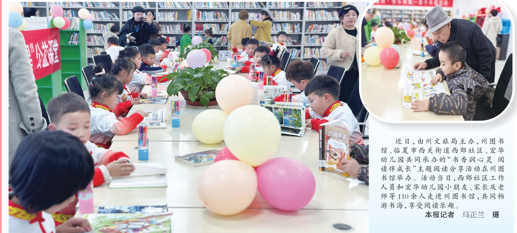
近日,由州文旅局主办,州图书馆、临夏市西关街道西郊社区、宏华幼儿园共同承办的“书香润心灵 阅读伴成长”主题阅读分享活动在州图书馆举办。活动当日,西郊社区工作人员和宏华幼儿园小朋友、家长及老师等110余人走进州图书馆,共同畅游书海,享受阅读乐趣。

“通过建立乡村就业工厂、帮扶车间,先后吸纳全市农村劳动力1500余人实现家门口就业,助力全市乡村振兴稳步推进。”该市人社局工作人员告诉记者,今后将继续加大对乡村就业工厂、帮扶车间的管理和支持力度,拓宽就业渠道,增加就业岗位,让群众在家门口稳定就业增收。