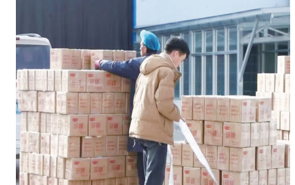
来,累计向帮扶企业、工厂及就业脱贫劳动力落实各类奖补271.1万元。

近年来,临夏市持续推进乡村就业工厂、帮扶车间建设,逐步发展成“发展车间”“致富车间”,让越来越多群众走上工作岗位,为乡村振兴注入新动能。截至目前,该市建成乡村就业工厂24家、帮扶车间19家,今年以