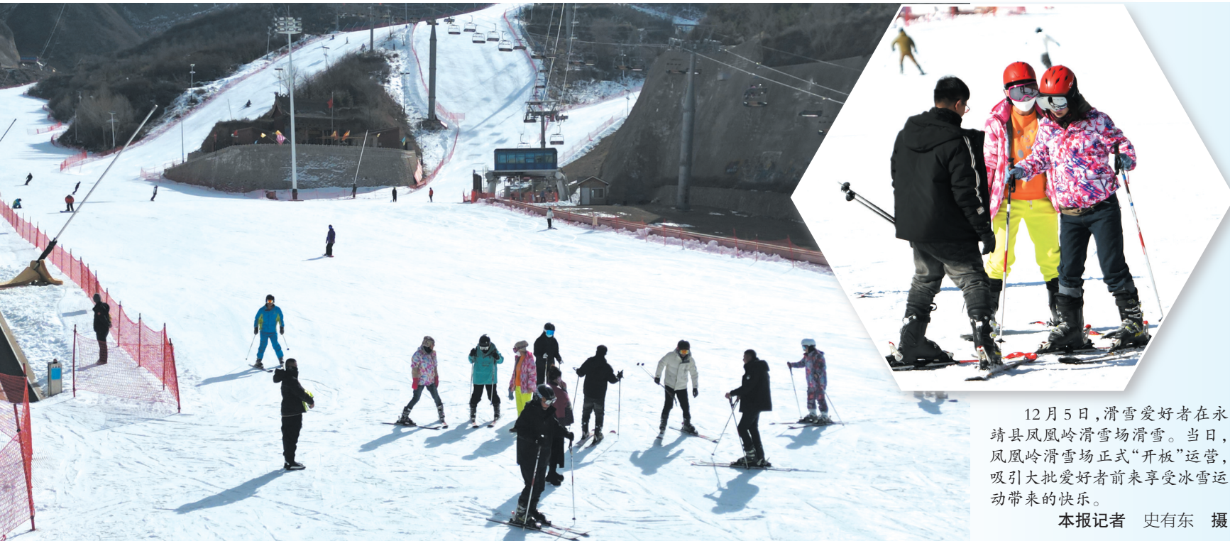
12月5日,滑雪爱好者在永靖县凤凰岭滑雪场滑雪。当日,凤凰岭滑雪场正式“开板”运营,吸引大批爱好者前来享受冰雪运动带来的快乐。

第六批群众举报件边督边改情况 中央第四生态环境保护督察组交办我州第六批群众举报件6件;情况属实6件。目前,已办结5件,阶段办结1件。具体办理情况公示如下(二维码):东乡县6件。