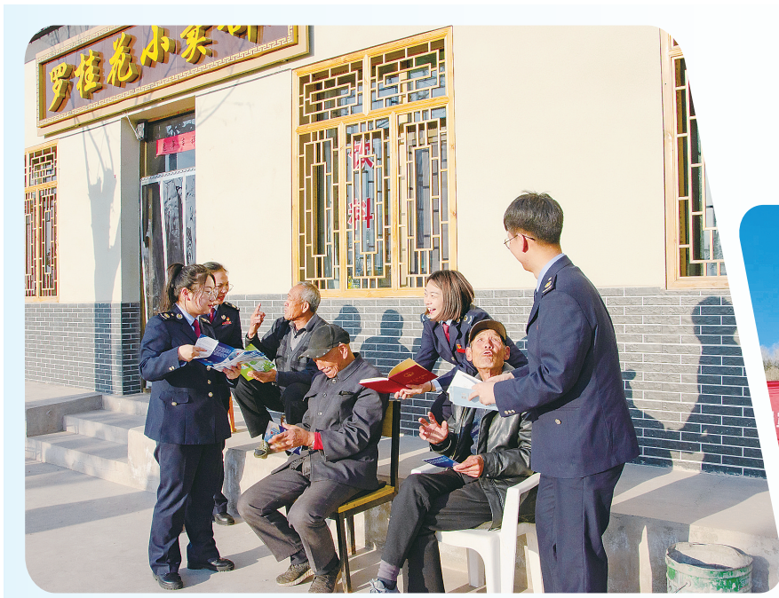
▲近日,永靖县税务局组织干部职工开展宪法宣传周活动,推进宪法进企业、进乡村、进社区、进校园、进家庭,提高群众法治素养。图为普法先锋队为群众讲解宪法及税收优惠政策。