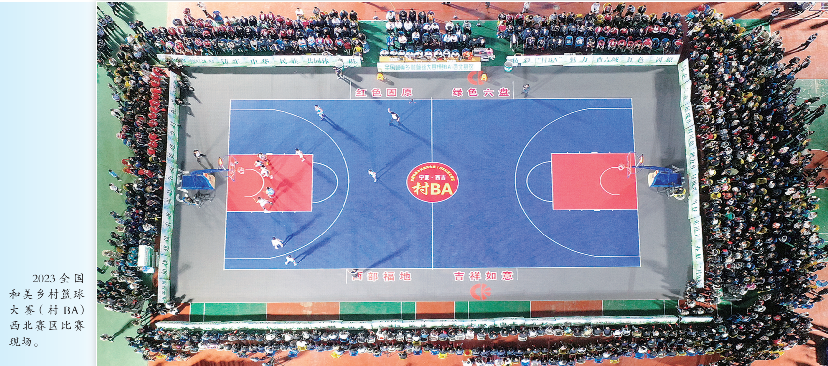
2023全国和美乡村篮球大赛(村BA)西北赛区比赛现场。