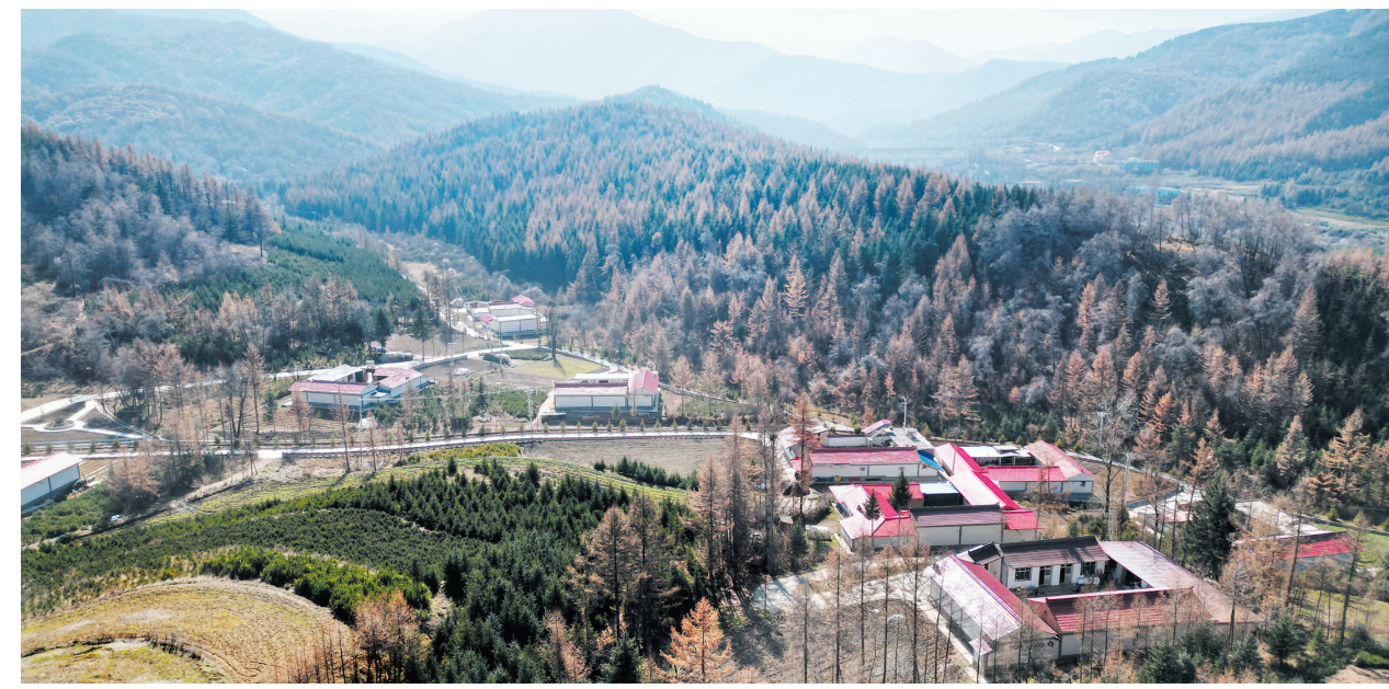
近年来,康乐县依托当地生态资源,不断推进乡村建设和环境整治,呈现出一幅幅“生态优美、产业兴旺、宜居宜业”的美和乡画卷。图为该县八松乡烈注村冬日景色。

本报讯 (记者 王伟如)主题教育开展以来,临夏县牢牢把握“学思想、强党性、重实践、建新功”总要求,全力以赴在深化理论学习、扎实开展调查研究、推动高质量发展、深刻检视整改上下功夫,一体化推进各项任务落实落地,推动主题教育扎实开展。 坚持以学铸魂,锤炼对党绝对忠诚。坚持用习近平新时代中国特色社会主义思想凝心铸魂,原原本本学习党的二十大精神、党章、《习近平著作选读》等文献资料,及时跟进学习习近平总书记关于主题教育系列重要讲话和重要指示批示精神,不断接受思想淬炼、精神洗礼,坚定对马克思主义的信仰、对中国特色社会主义的信念、对实现中华民族伟大复兴中国梦的信心,深刻领悟“两个确立”的决定性意义,不断增强“四个意识”、坚定“四个自信”、做到“两个维护”,在思想上政治上行动上始终同以习近平同志为核心的党中央保持高度一致。 坚持以学正风,大兴实干务实之风。坚持把调查研究作为做好各项工作的基本功,立足全县发展实际和工作需要,聚焦经济社会发展中的各类难点问题,深入基层一线,直面问题、了解实情,广泛听取意见建议,深入思考推动问题解决的措施办法,提出有针对性、操作性、科学性的意见建议,推动调查研究深入开展。 坚持以学促干,推动经济社会发展。紧紧围绕该县整体推进“三大片区”、深度开发“五大流域”、全力打造“五个县”的部署要求,持续推进项目建设大提速、招商引资大赶超、特色产业大提质、营商环境大优化行动,奋力推动经济社会各项事业发展取得显著成效。