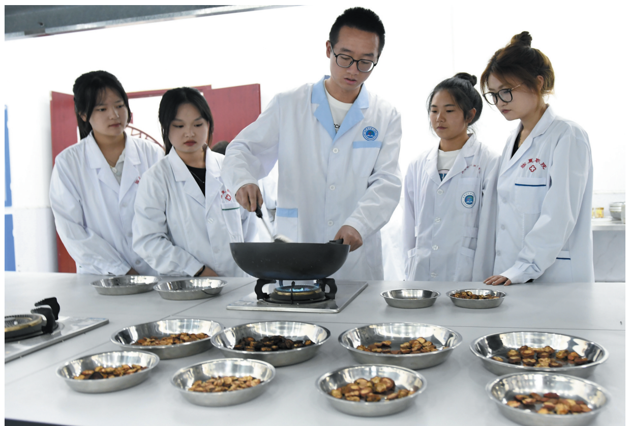
近年来,临夏现代职业学院以促进就业为导向,通过“产教融合、校企合作、订单培养”等办学模式,根据市场需求开设护理、中药学和舞蹈等专业,有针对性地培养适合岗位的技能人才,切实提高学生就业率。图为中药学专业的学生在上中药炮制实训课。

职级优秀驻村干部43名。强化教育培训,提升驻村干部履职能力。在常态化开展专题教育培训的同时,每月召开驻村帮扶队长例会,全面系统解读中央、省州最新政策和驻村帮扶相关要求,安排推动具体工作。今年以来,共举办驻村帮扶干部培训班7期,累计参训1950人次;编印《巩固拓展脱贫攻坚成果同乡村振兴有效衔接帮扶工作100问》口袋书1500份,方便干部随时随地学习;从10月份开始分三轮对乡村干部和驻村帮扶干部开展巩固拓展脱贫攻坚成果同乡村振兴有效衔接知识闭卷考试,以考促学、以考促干,不断提升驻村干部履职尽责能力。