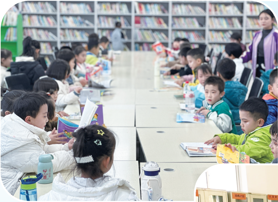
11月14日，由州文旅局主办、州图书馆和临夏市民族保育院承办的“同成长·共快乐”——少儿绘本故事阅读分享活动在州图书馆举办，该市民族保育院的90名小朋友参加。