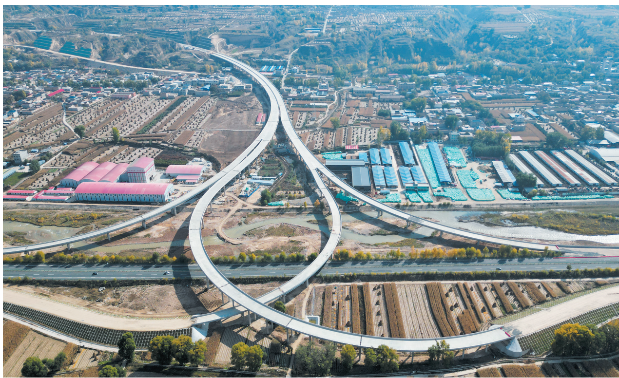
临康广高速公路是我省路网规划中省级高速公路18条联络线之一，也是G75兰海高速公路与G1816乌玛高速公路的联络通道，全长35.773公里，预算投资65.73亿元。图为近日拍摄的临康广高速公路广河立交互通。

本报讯(记者 马茹萍 马瑞鹏)每年的“双十一”既是消费者的网购节日，也是电商企业冲刺全年销售的重要节点。连日来，广河县各电商企业抢抓“双十一”消费热点，纷纷鼓足干劲、备足货源，全面备战一年一度的网购大潮。 今年，广河县各部门积极联动，力争电商销售额突破6000万元。记者在正清电子商务有限公司，看到精心布置了带有“迎战双十一”字样的各类挂件，电