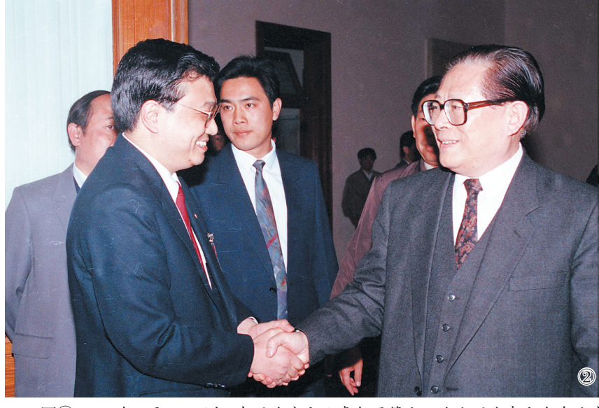
图②:1993年5月3日下午,中国共产主义青年团第十三次全国代表大会在北京人民大会堂开幕。在5月3日上午的预备会议后,举行第一次主席团会议,推选李克强等同志为主席团常务主席。这是江泽民同志与李克强同志握手。