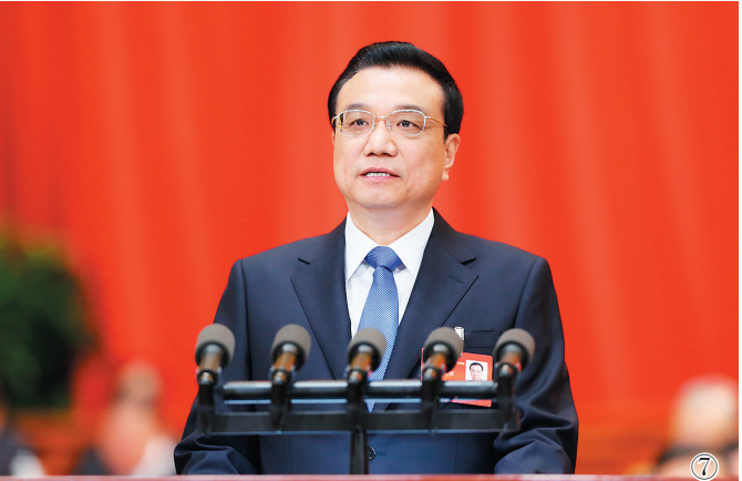
图⑦:2013年3月5日,第十二届全国人民代表大会第二次会议在北京人民大会堂开幕。李克强同志作政府工作报告。