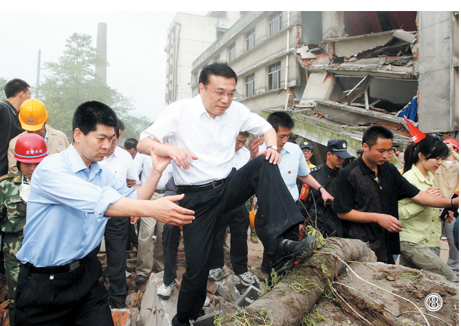
图⑧:2008年5月19日,李克强同志在四川地震灾区察看灾情。