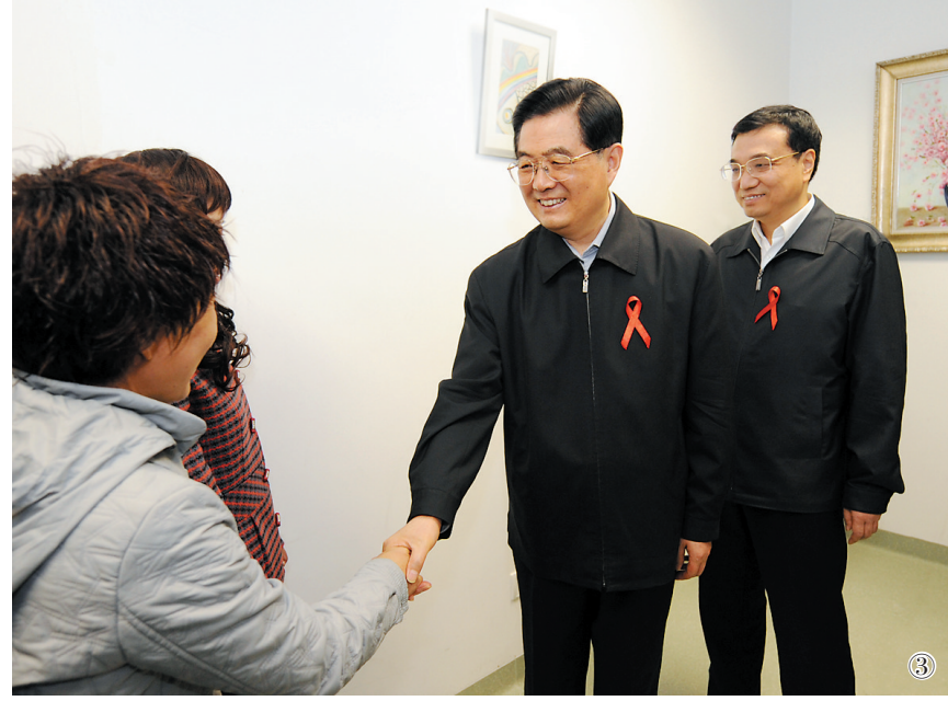
图③:2008年12月1日是第21个世界艾滋病日。胡锦涛同志和李克强同志来到北京地坛医院考察艾滋病防治工作。