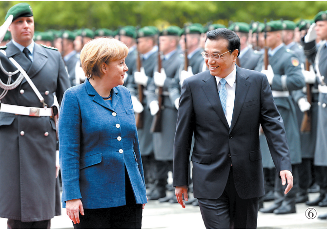
图⑥:2013年5月26日,李克强同志在柏林出席德国总理默克尔举行的欢迎仪式。