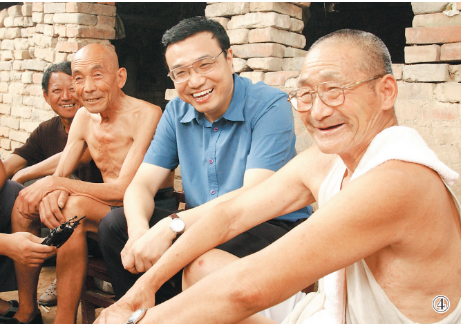
图④:2003年8月8日,李克强同志在河南省新乡市调研。这是李克强同志在原阳县桥北乡马庄村与村民亲切交谈。