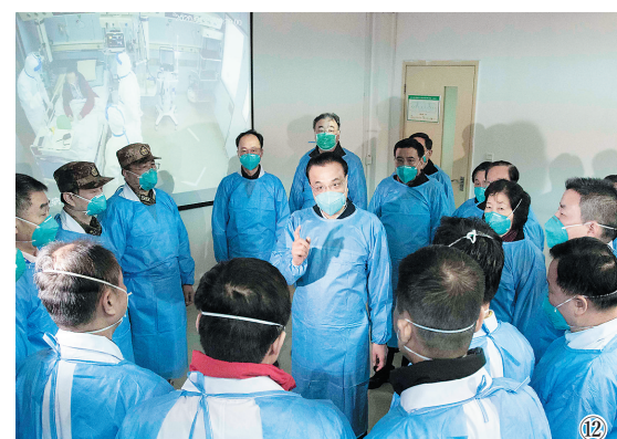
图⑫:2020年1月27日,李克强同志赴湖北省武汉市考察指导疫情防控工作,代表党中央、国务院慰问疫情防控一线的医务人员。