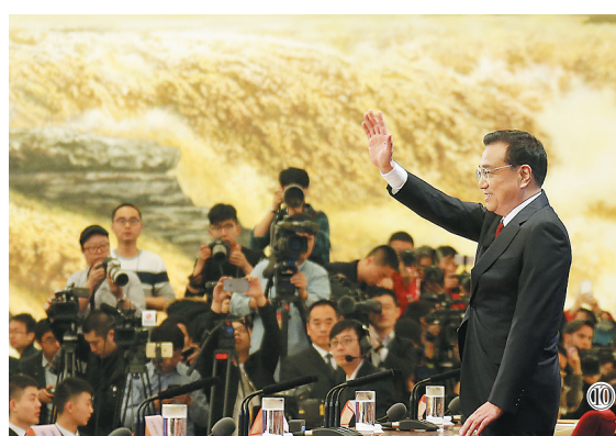
图⑩:2016年3月16日,李克强同志在北京人民大会堂与中外记者见面,并回答记者提问。

李克强同志的一生,是革命的一生、奋斗的一生,光辉的一生,是全心全意为人民服务的一生,是献身于共产主义事业的一生。他的逝世,是党和国家的重大损失。我们要化悲痛为力量,学习他的革命精神、崇高品德和优良作风,更加紧密地团结在以习近平同志为核心的党中央周围,高举中国特色社会主义伟大旗帜,全面贯彻习近平新时代中国特色社会主义思想,深刻领悟“两个确立”的决定性意义,增强“四个意识”、坚定“四个自信”、做到“两个维护”,坚定信心、同心同德,踔厉奋发、勇毅前行,为以中国式现代化全面推进强国建设、民族复兴伟业而团结奋斗。 李克强同志永垂不朽!