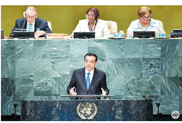
图⑪:2016年9月21日,李克强同志在纽约联合国总部出席第71届联合国大会以“可持续发展目标:共同努力改造我们的世界”为主题的一般性辩论并发表题为《携手建设和平稳定可持续发展的世界》的讲话。