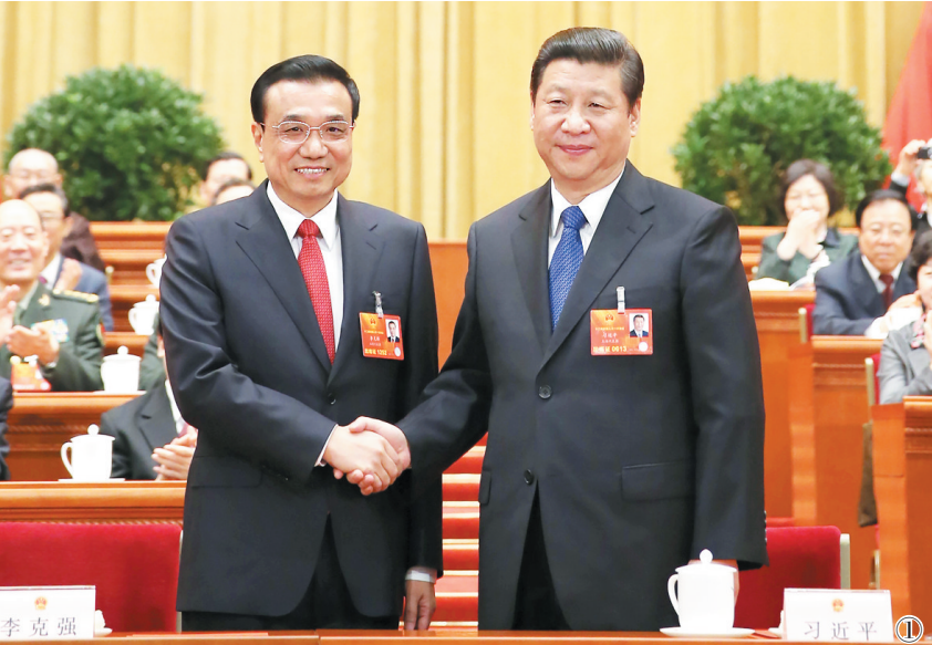
图①:2013年3月15日,第十二届全国人民代表大会第一次会议在北京人民大会堂举行第五次全体会议。会议经过投票表决,决定李克强为中华人民共和国国务院总理。这是习近平同志和李克强同志亲切握手。