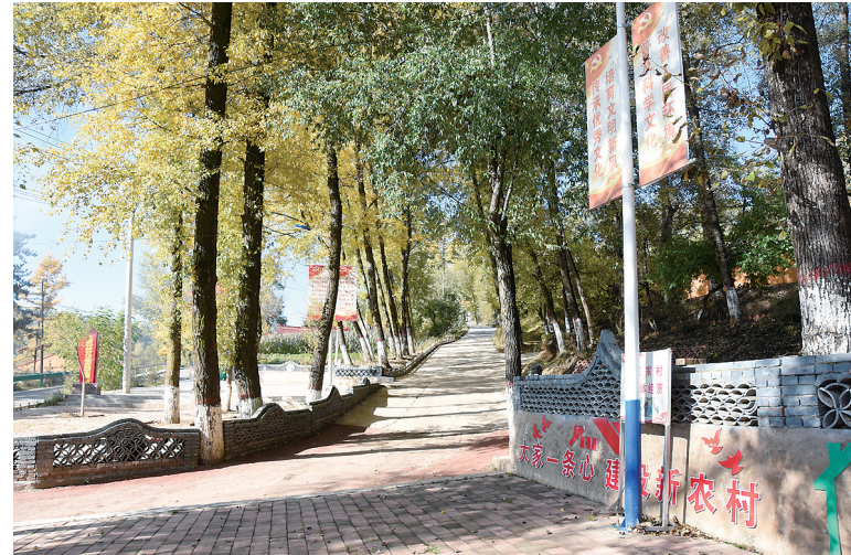
上王家村文化广场一角