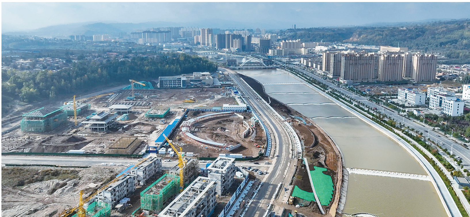
滨河东区文化旅游建设项目