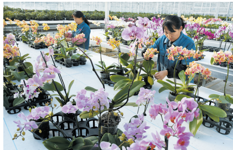
百益国际现代花卉产业园