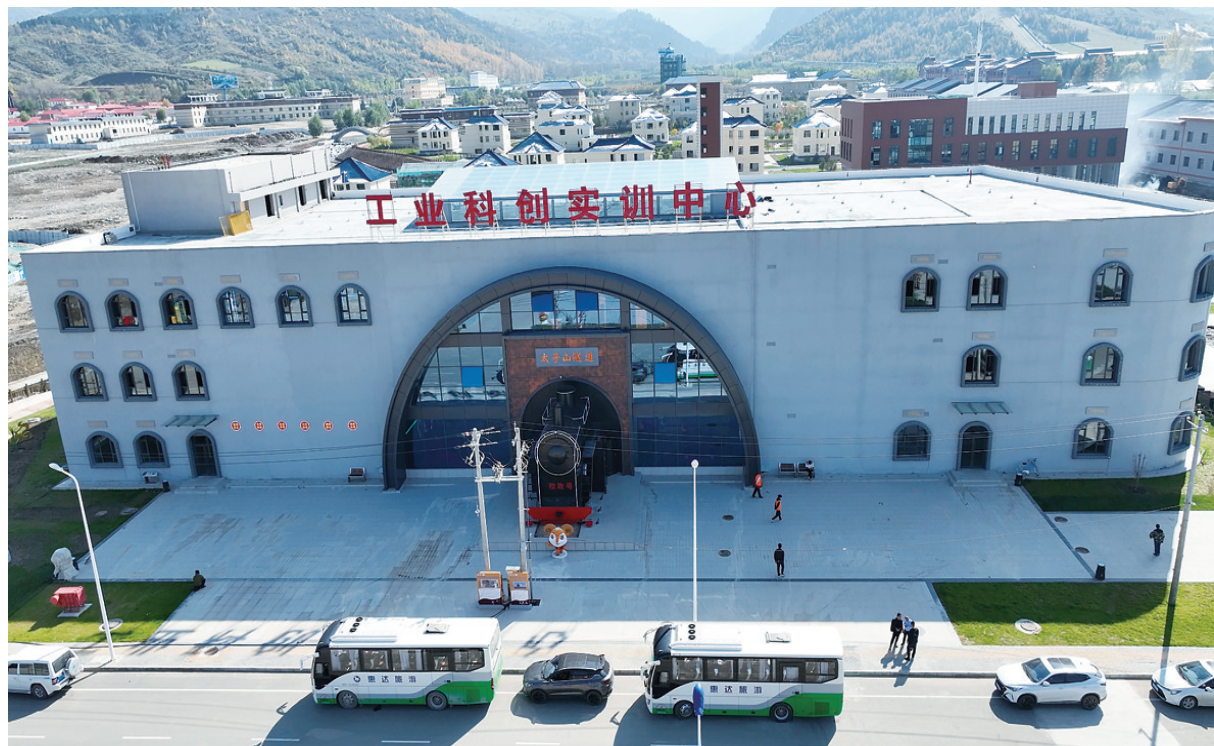
松鸣岩中国式现代化学生劳动实践综合基地