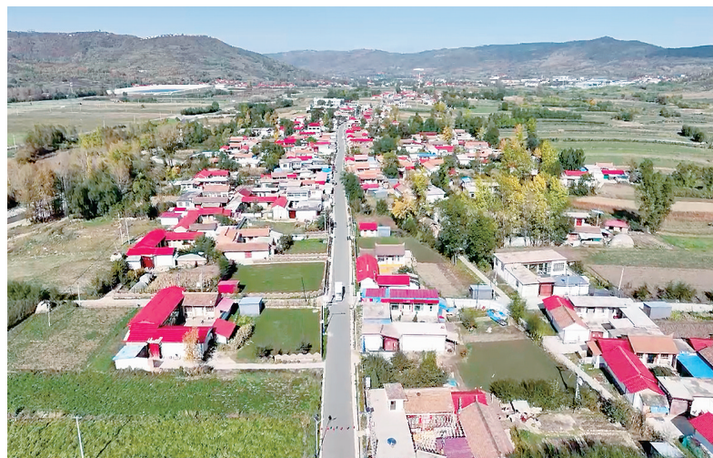
和美乡村——狼土泉村