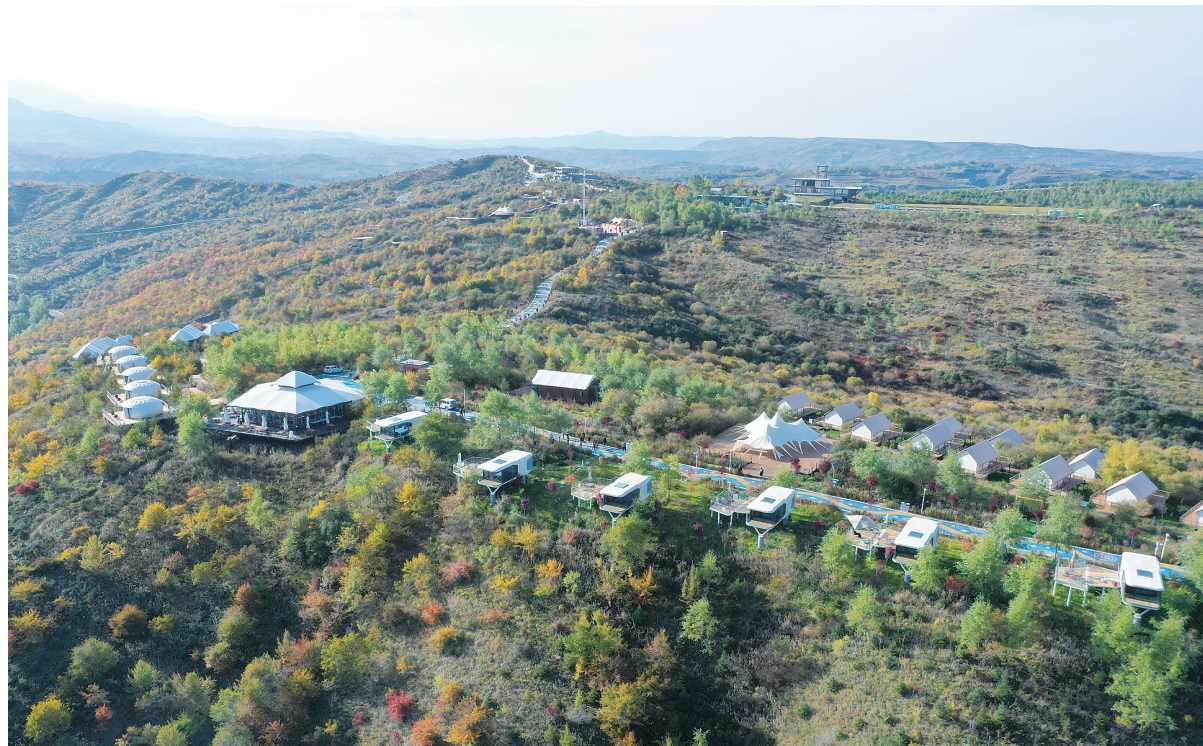
大桦梁星语云端旅游景区