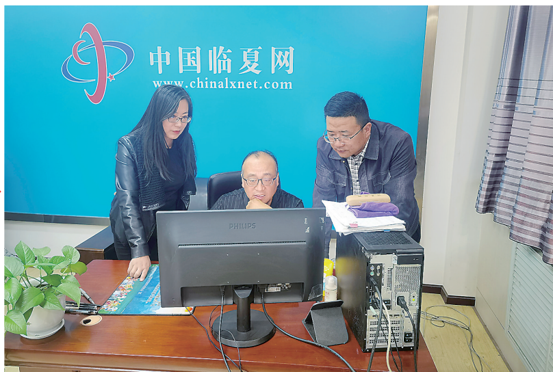
中国临夏网编辑优化栏目

(接2版)——采取“走出去”和“请进来”的方式,邀请中央和省级主流媒体新闻专家开展专题讲座培训,并分别前往山东、青海及兰州、张掖、甘南等地就建立信息互通、资源共享、宣传协作机制进行了考察学习,努力把临夏声音传得更开更广。