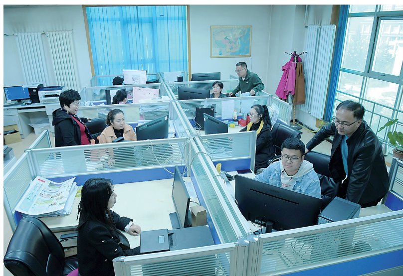
报纸编辑部编审稿件