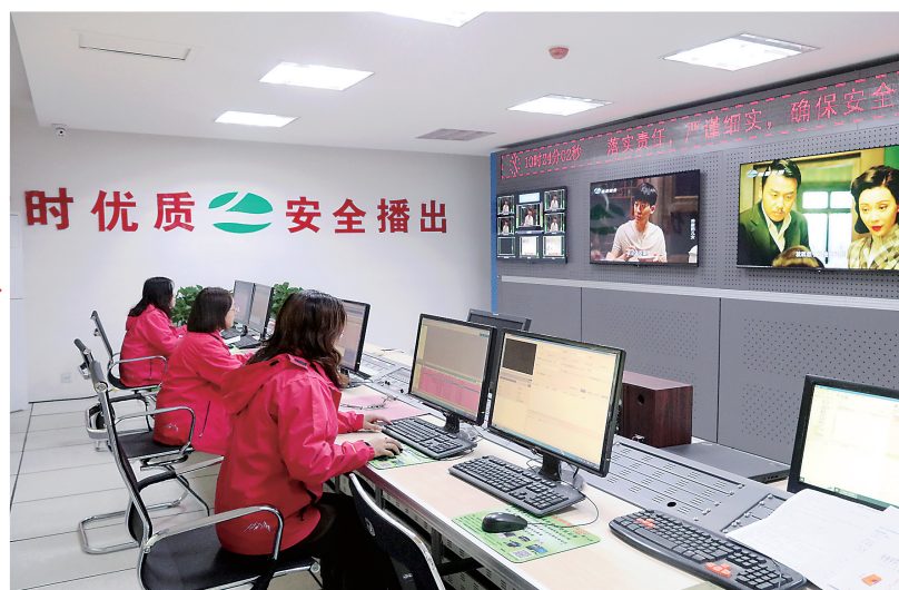
电视节目制作播控