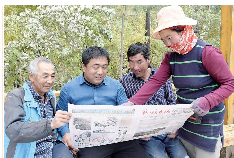
群众在阅读《民族日报》