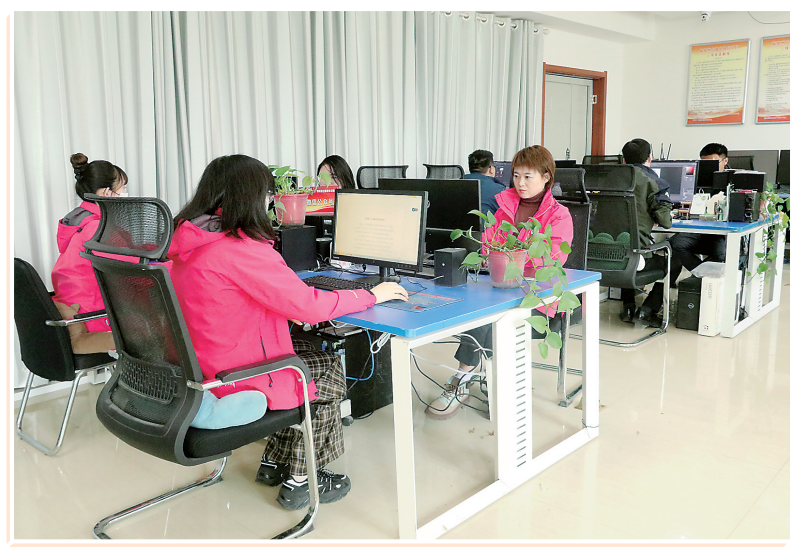
新媒体编辑部制作新闻产品

回首过去,我们心怀坦荡;立足今日,我们胸有成竹;展望未来,我们信心百倍。站在新的起点上,临夏州融媒体中心将紧紧围绕媒体改革的总目标,不负韶华、融创未来,后浪和前浪一起奔涌,网上和网下同频共振,以肩上担责、眼里闪光、心中燃火、手上有活、脚下留印的新时代媒体人,不断扩大“花儿临夏 在河之州”品牌的影响力。