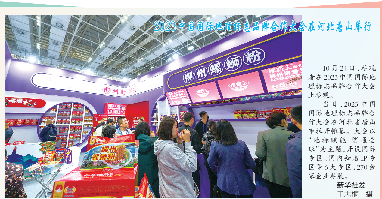
10月24日，参与者在2023中国国际地理标志品牌合作大会上参观。当日，2023中国国际地理标志品牌合作大会在河北省唐山市拉开帷幕。大会以“地标赋能 贯通全球”为主题，开设国际专区、国内知名IP专区等6大专区，270余家企业参展。

态保护优先、合理利用自然资源、推动户外运动项目合理布局等；二是加强户外运动场地设施建设，包括推动体育公园建设、构建国家步道体系、优化冰雪运动设施布局、完善山地户外运动设施、增加水上运动设施供给、支持露营地建设、培育汽车自驾运动营地、加强航空飞行营地建设等；三是提升户外运动服务供给质量，包括丰富户外运动赛事活动供给、提升户外运动科技应用水平、完善户外运动安全救援机制、加强户外运动标准化建设、普及户外运动文化与技能等；四是促进户外运动产业创新发展，包括加强产业政策集成创新、创新土地供应方式、构建户外运动装备运输新机制、激发民营户外运动企业发展活力、发挥户外运动产业就业增收功能等。