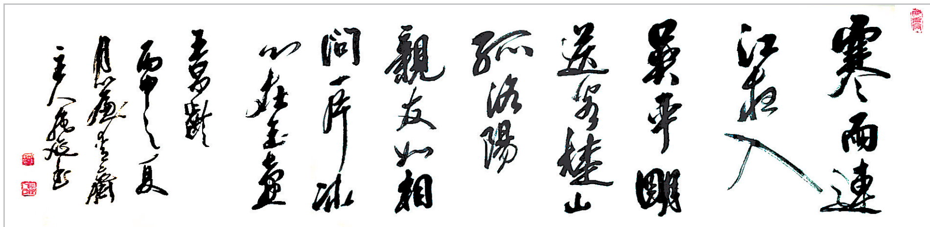
书法 宛廷聚 作