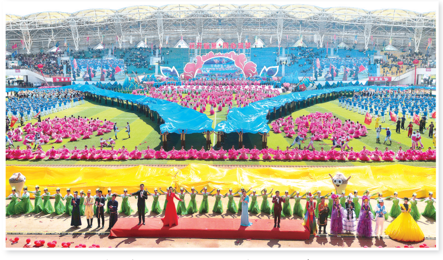
甘肃省第十届少数民族传统体育运动会开幕式现场