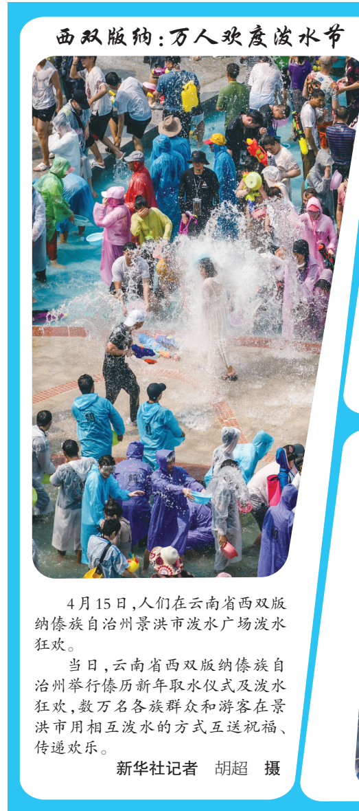
西双版纳:万人欢度泼水节

19393012345(微信同号) 临夏州矛盾纠纷调处服务中心服务热线: 0930—8812345 18215012345(微信同号) 特此公告 临夏州社会治安综合治理中心 2023年4月18日