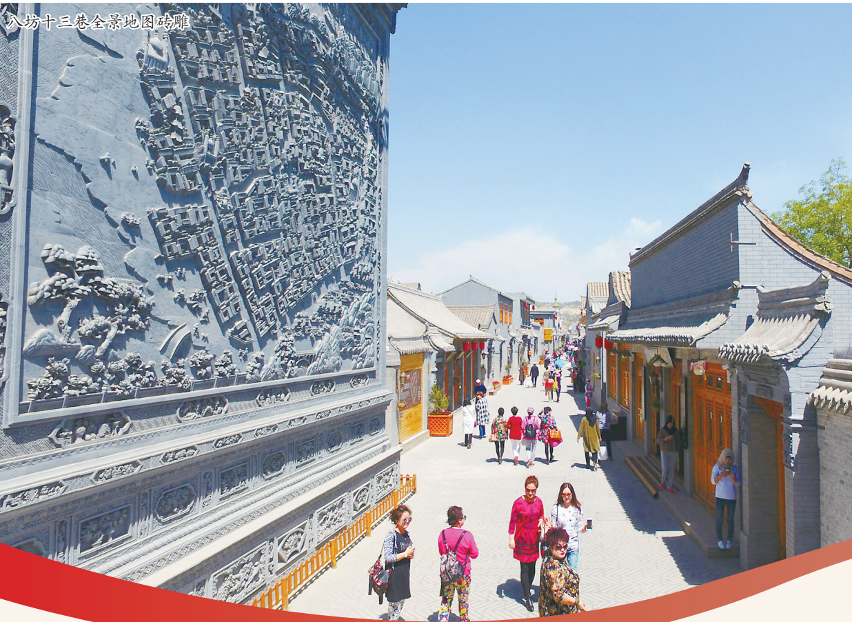
八坊十三巷全景地图砖雕