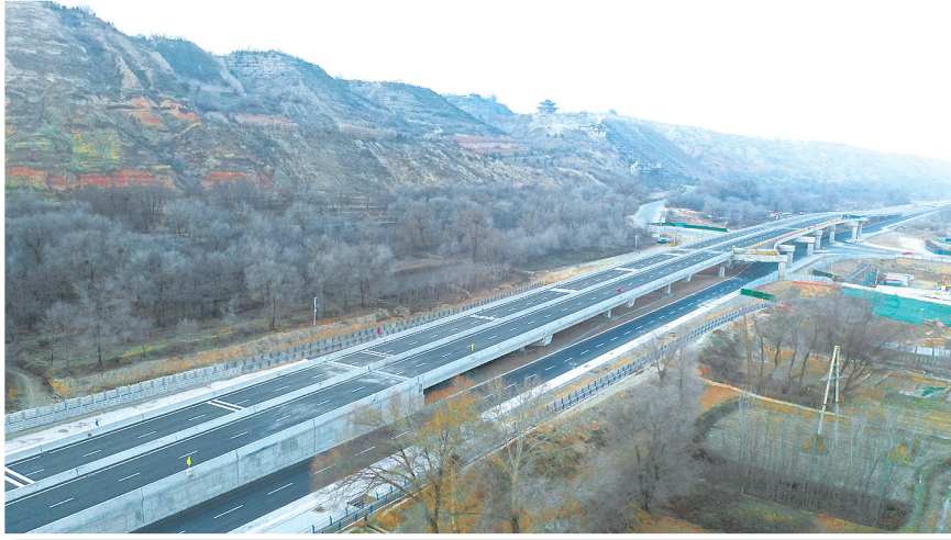
临夏市环城北路城东五路跨线桥2022年9月完成建设,全长570米,桥宽17米。