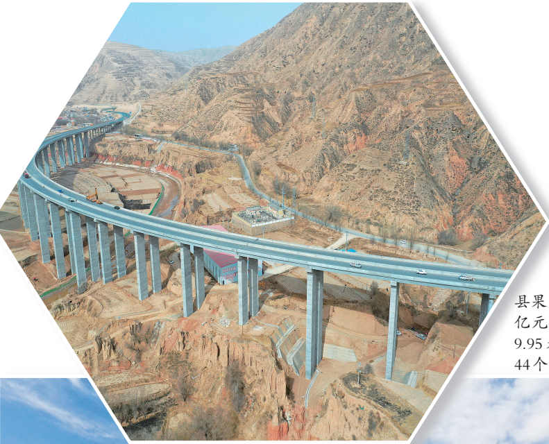
▲果园特大桥位于东乡县果园镇石拉泉村,总投资1.4亿元,桥长1448米,单幅桥宽9.95米,该特大桥拥有薄壁墩44个,圆柱墩44个,方墩6个。