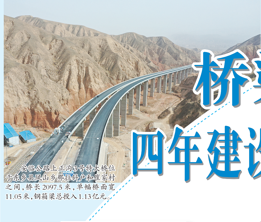
安临公路上正沟3号特大桥位于东乡县凤山乡那拉斜户和崔家村之间,桥长2097.5米,单幅桥面宽11.05米,钢箱梁总投入1.13亿元。