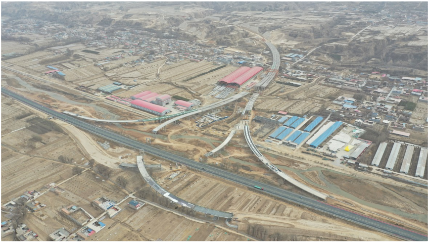
广河东枢纽立交互通位于广河县祁家集镇蔡王家村南侧,总投资1.87亿元,该立交与S2兰郎高速相接,紧邻S309与X370,桥梁全长1359.95米。