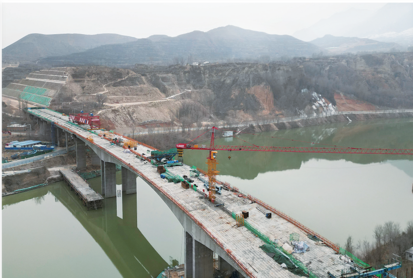
临大高速公路大河家黄河大桥位于积石山县大河家镇康吊村和青海省民和县官亭镇河沿村之间,总投资8600万元,桥长548米,标准路基宽25.5米。