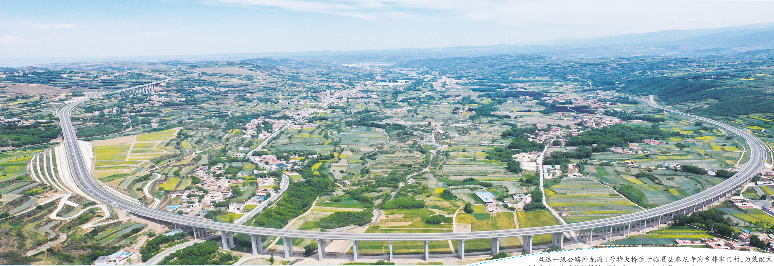
双达一级公路卧龙沟1号特大桥位于临夏县麻尼寺沟乡韩家门村,为装配式预应力混凝土连续箱梁桥,总投资8500万元,全长1207米。