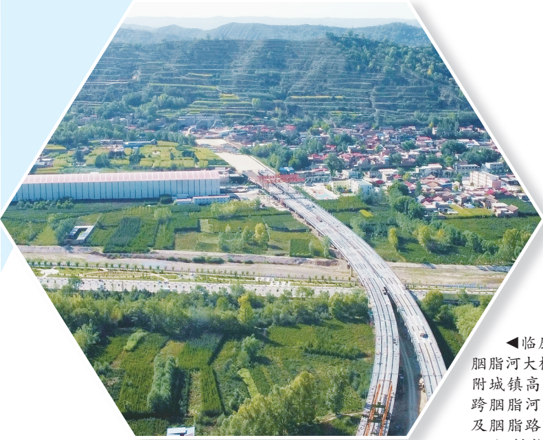
▲临康广高速公路胭脂河大桥位于康乐县附城镇高丰村,桥梁横跨胭脂河、城东滨河路及胭脂路,总投资7076万元,桥长827.5米。

同时,这些在重要交通交汇点建造的桥梁,按照不同的道路规划来设计建造,每一座看上去都是一件造型魁伟的艺术品。日前,记者用手中之无人机,从高空俯瞰定格了部分桥梁的宏伟壮观之美,以飨读者。