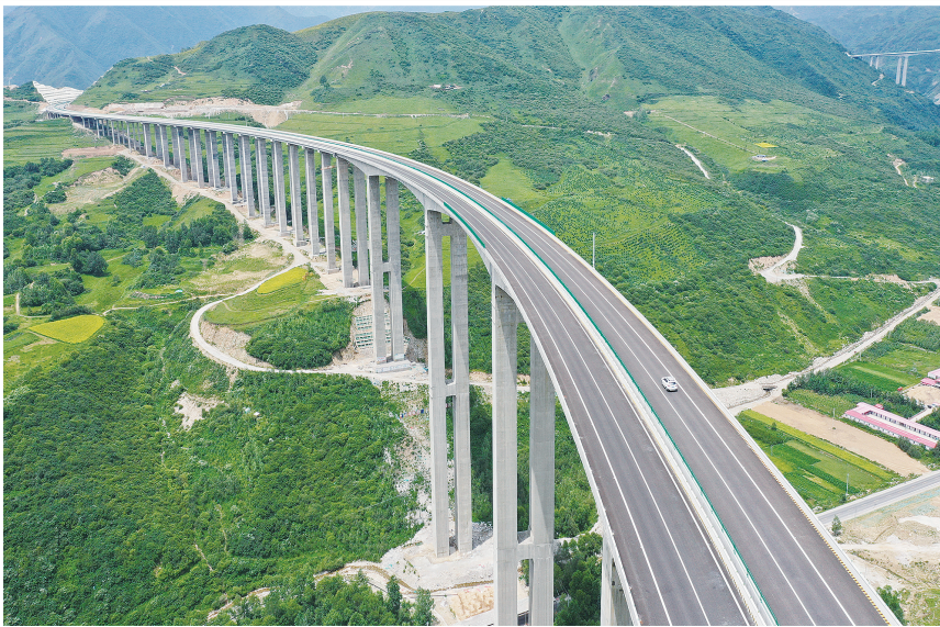
双达一级公路卧龙沟2号特大桥位于临夏县麻尼寺沟乡卧龙沟村,总投资3.5亿元,桥长1818米,主桥单孔最大跨径140米,最大墩高162米。