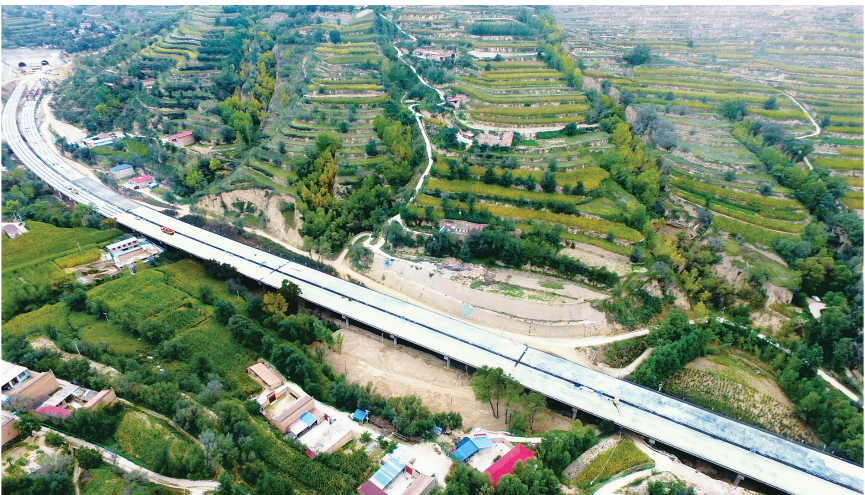
临康广高速公路二甲沟特大桥位于康乐县流川乡二甲沟村,总投资达约1.02亿元,桥长1192.5米。