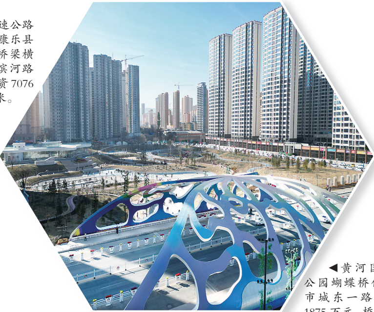
▲黄河国家文化公园蝴蝶桥位于临夏市城东一路,总投资1875万元,桥长53米,桥宽42米,2022年10月完成建设。