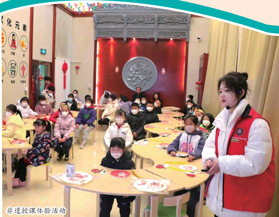
非遗授课体验活动