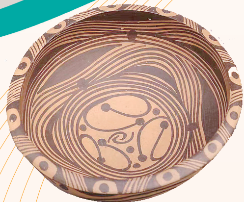
马家窑文化马家窑类型水波纹彩陶盆

让静态的文物“动”起来、会“说话”。目前，州博物馆采用VR全景展览系统让观众在线上也可身临其境观展，千年神秘彩陶古玉缤纷呈现，可透过文物了解古河州丰富悠远的历史，州内各遗址点一览而尽，彩陶器上的纹路，日月星辰，花鸟虫鱼，几何中的对称，天文中的概念……能让你静下心来用指尖触碰远古先民的智慧与彩陶的神秘魅力，于方寸之间，游万千年月，实景VR运用是西北五省首例。在这里，来一次属于自己的文博之旅，遇见过去的临夏，在这里，读懂中国文化。