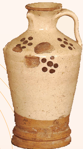
西夏民窑白釉梅点纹双肩耳瓶