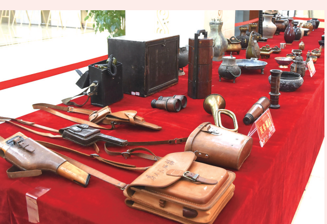
社会捐赠民俗藏品