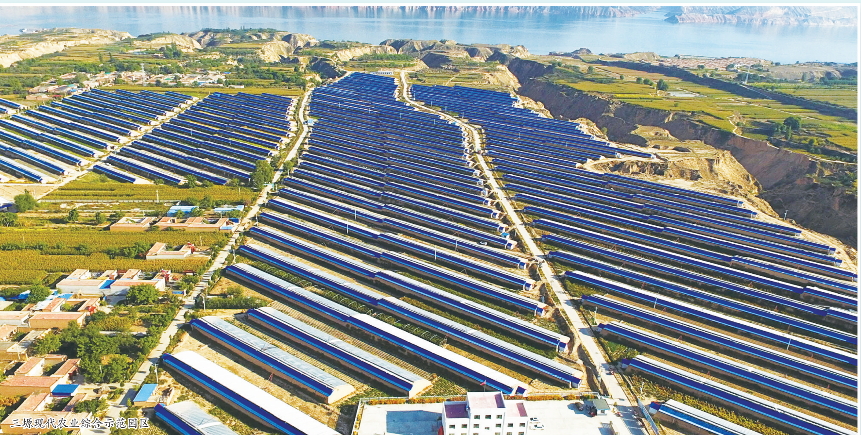
三塬现代农业综合示范园区