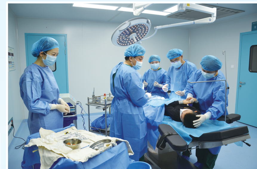
基层卫生院进行千级层流手术