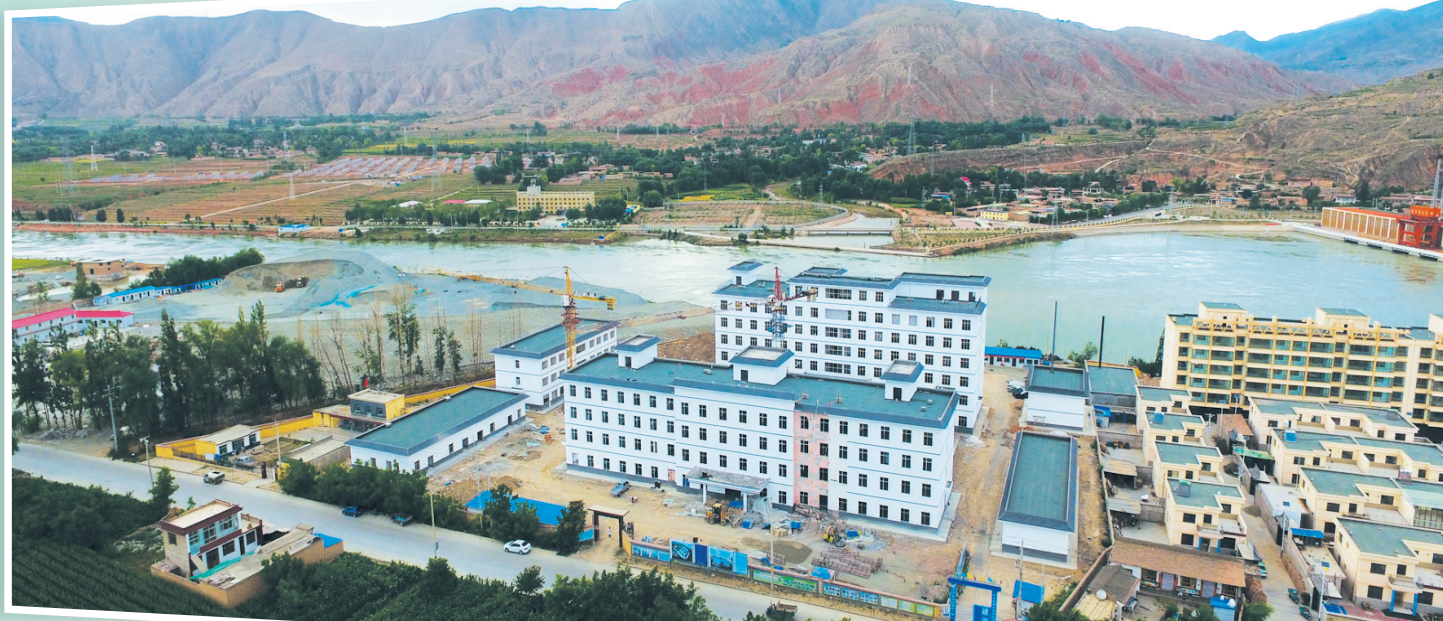
积石山县中西医结合医院建设项目