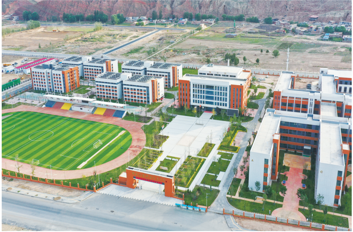
临夏国强职业技术学校