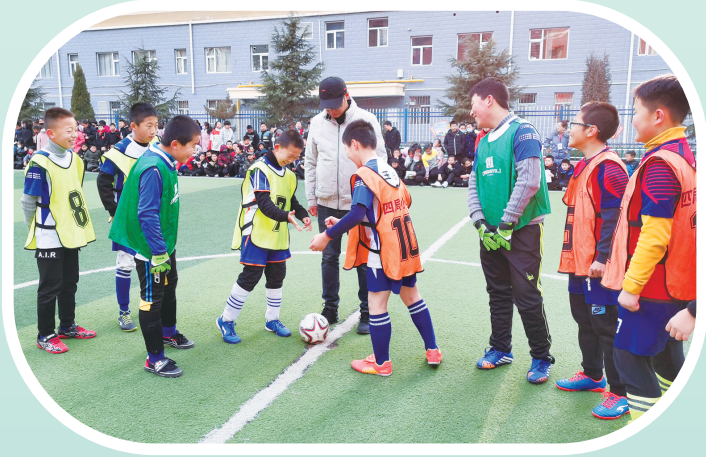
小学生进行足球训练