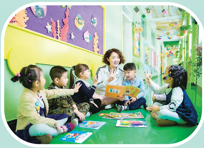
幼儿园教师和孩子们一起读绘本