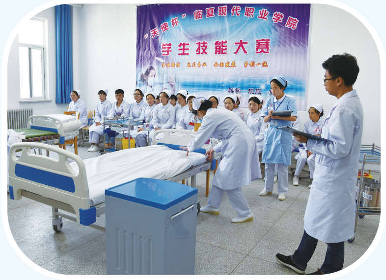
临夏现代职业学院卫生系学生开展技能大赛