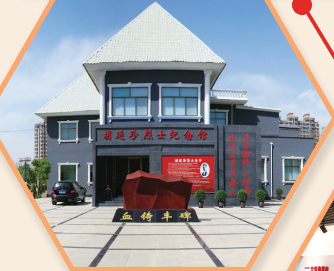
胡廷珍烈士纪念馆