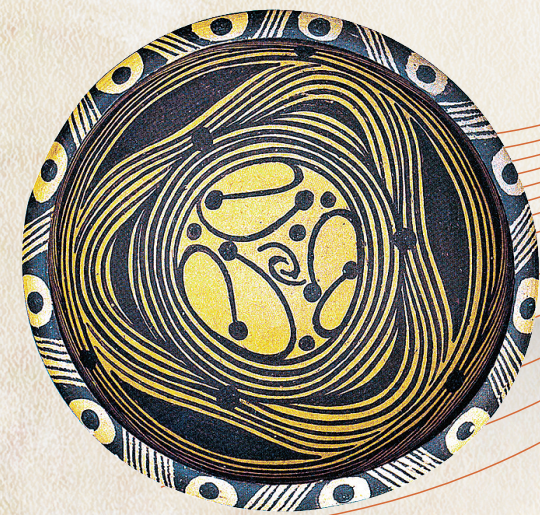
马家窑文化马家窑类型圆点弧线水波纹彩陶盆