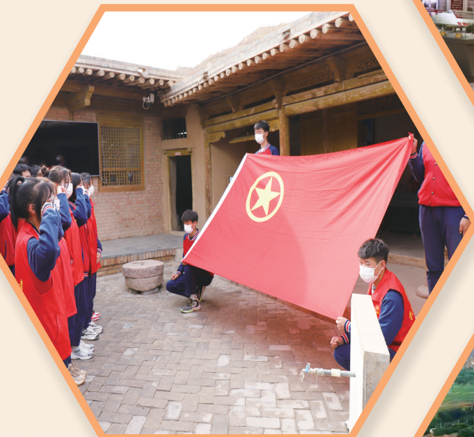
在布楞沟村史馆开展红色研学活动