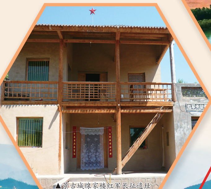
▲景古城隍家楼红军长征遗址