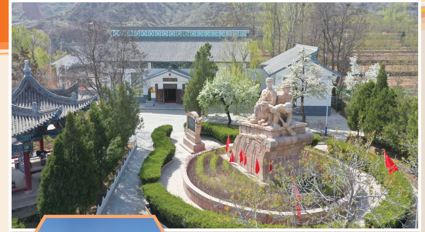
解放军抢渡黄河纪念馆