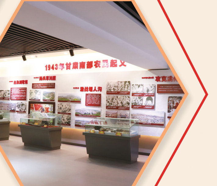
肋巴佛革命纪念馆