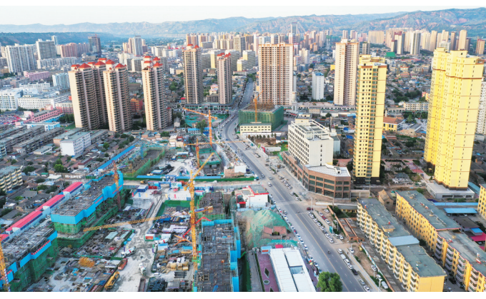
临夏市华寺西路棚户区改造项目建设现场