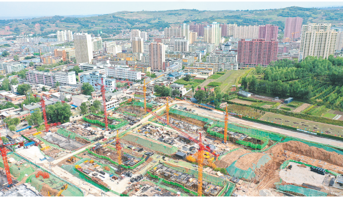
积石山县城棚户区改造项目建设现场