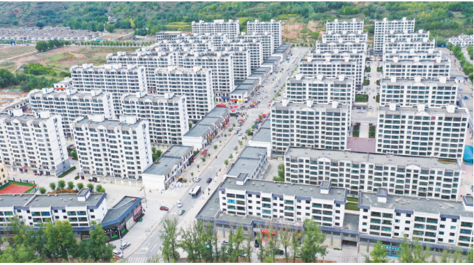
临夏县县城易地扶贫搬迁点