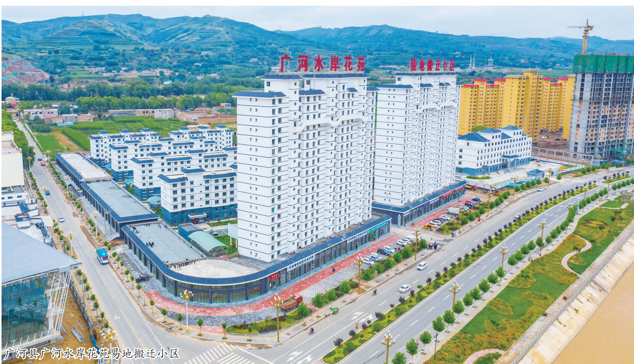
广河县广河水岸花苑易地搬迁小区