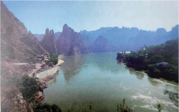
两岸船泊处是原天下第一桥遗址处

哲人处陋用箴规,始终悠然不诡随。一贯静中皆自得,三才品里许谁居。濂溪夫子窗前意,康节先生首尾诗。楚楚冠裳联芳问,香消金甲愈孜孜。