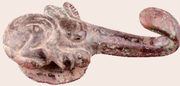
汉 兔纹带钩 西安博物院