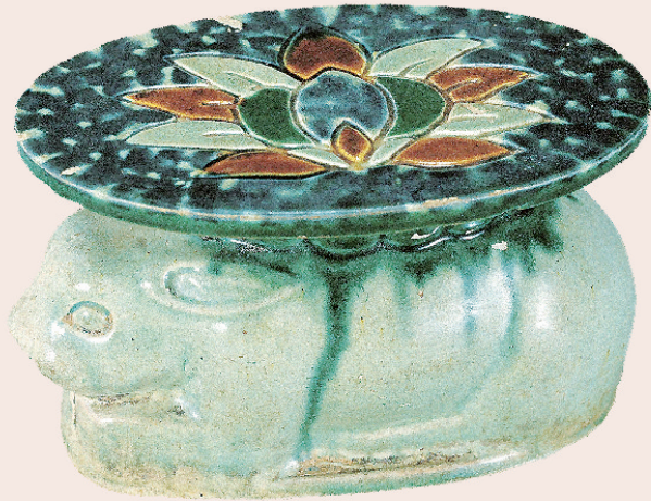
唐 三彩卧兔枕 河北博物院