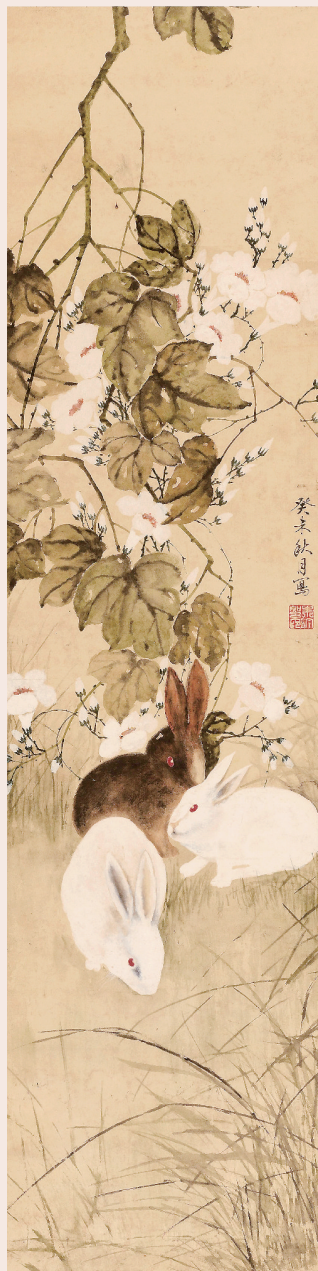
宋 吟絮花并白兔 安徽博物院