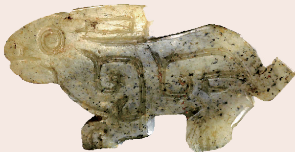
商 墨玉兔形佩 天津博物馆