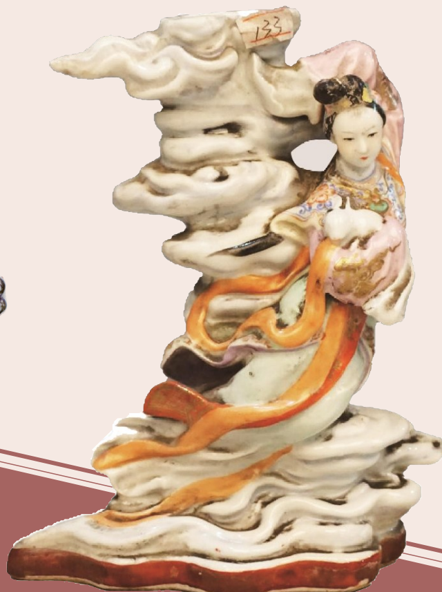
现代 加彩嫦娥奔月雕瓷合灯 景德镇中国陶瓷博物馆