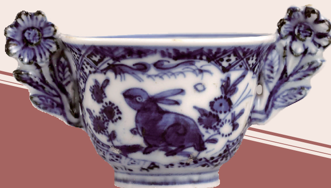
明万历 青花开光花卉兔纹双耳杯 故宫博物院