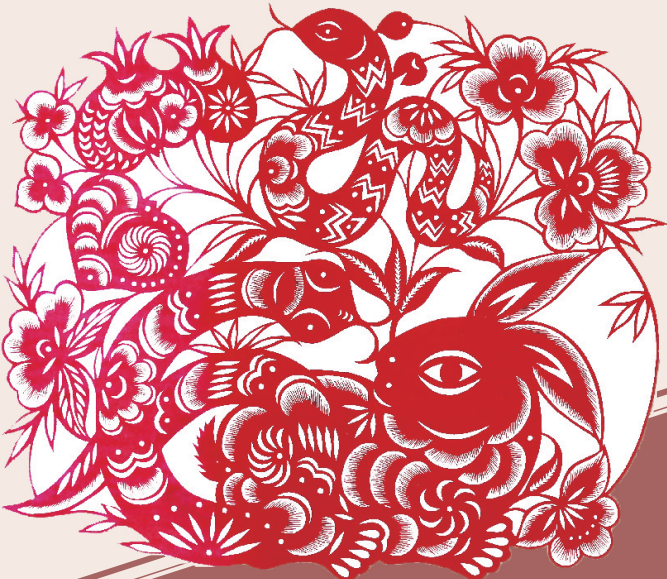
现代 “生肖全家福—轮与兔”剪纸 中国妇女儿童博物馆