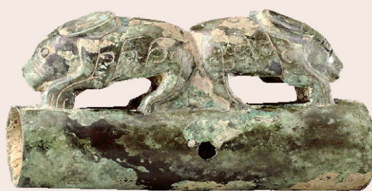
西周 双兔车韦 故宫博物院