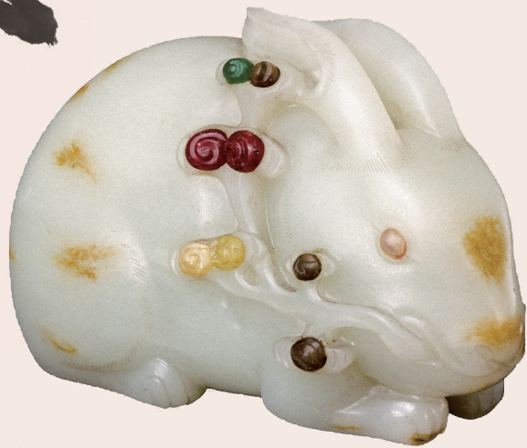
清 青玉嵌宝石卧兔 故宫博物院