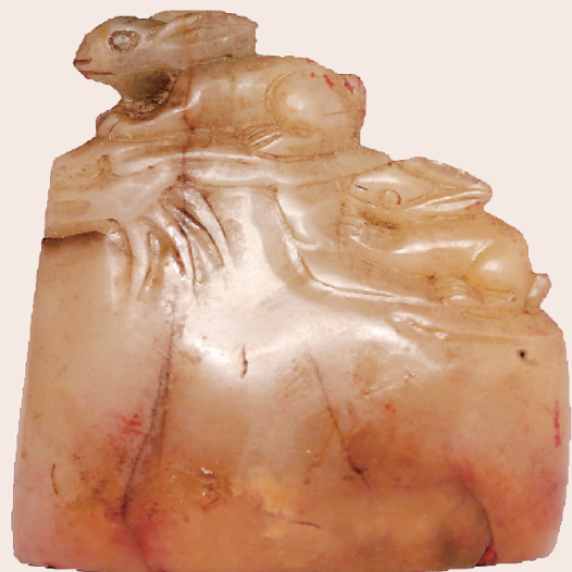
民国 高山兔钮天然章 福建博物院