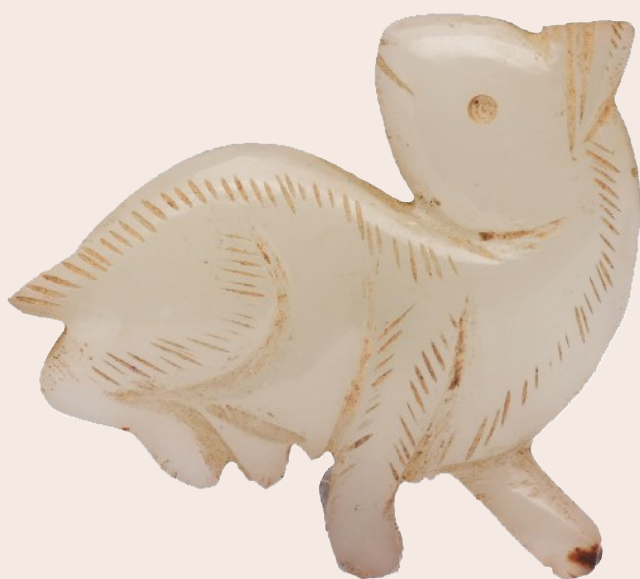
明 玉兔饰件 长沙博物馆