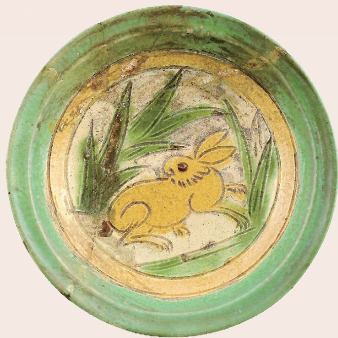
辽 三彩釉兔纹碟 辽宁省博物馆