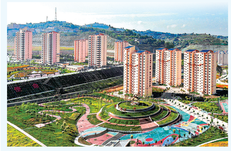
东乡县城易地扶贫搬迁点