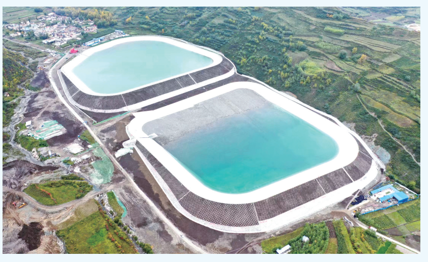
石门滩水库蓄水池