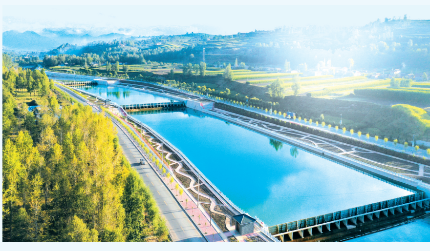
大南岔河流域水生态修复治理工程

又能早开工、可见效、促增长的大项目、好项目。并以咬定青山不放松的执着,全力推动项目建设高歌猛进、产业发展上档升级、民生福祉持续增进,创造了“临夏速度”,实现了“增量”“提质”双突破,在推动高质量发展、实现后来居上征程中迈出了坚实步伐。 如今,一幅壮丽宏大的项目建设画卷在临夏大地全面铺开,从高端装备制造到绿色食品加工,再到新型材料;从基础设施到现代服务业,再到社会民生,项目建设“遍地开花”,产城融合“全面出彩”,临夏激昂奋进的活力场景振奋人心。未来临夏,精彩可期。