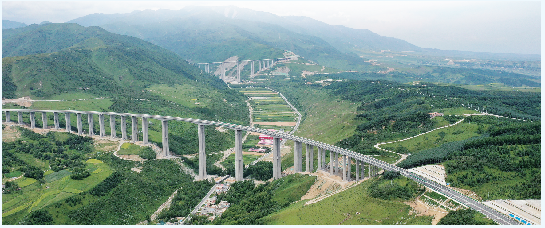
双城至达里加一级公路卧龙沟2号特大桥