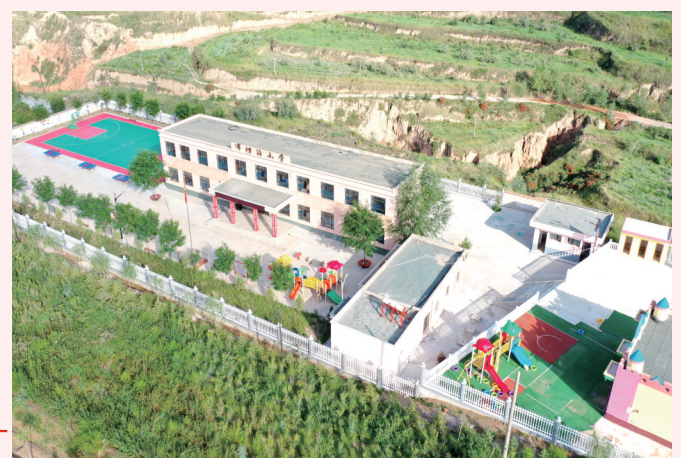
布楞沟村小学及幼儿园