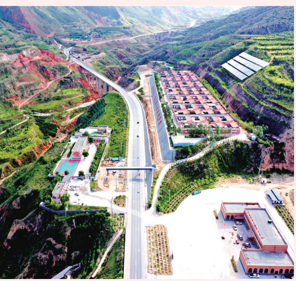
折红二级公路穿村而过