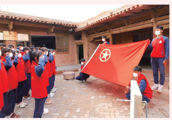
在布楞沟村史馆开展红色研学活动