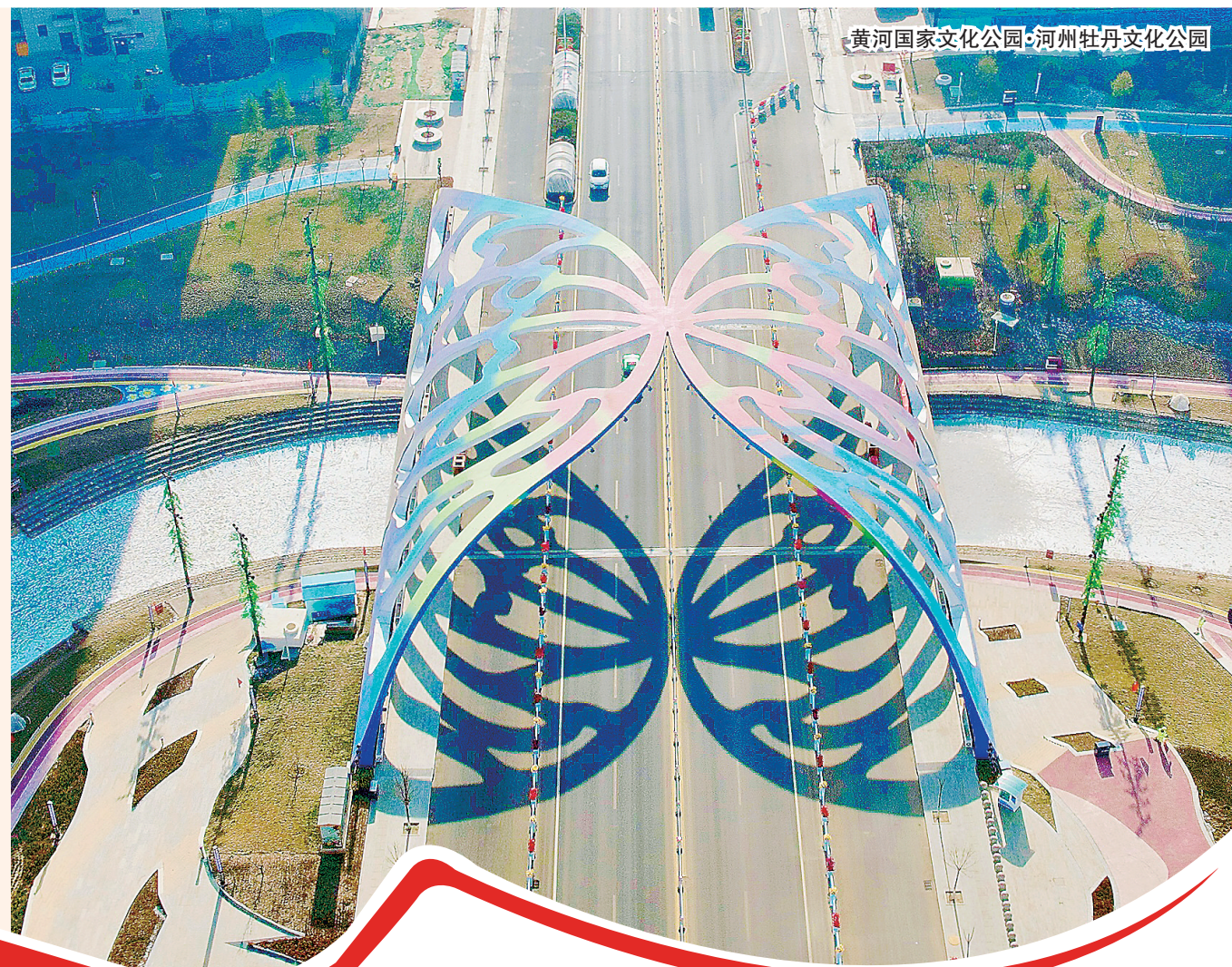
黄河国家文化公园·河州牡丹文化公园