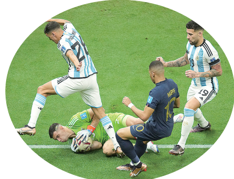
12月18日,阿根廷队守门员马丁内斯(下)在比赛中扑救。当日,阿根廷队对阵法国队。

新华社广州1月14日电 国际足联13日宣布,国际足联纪律委员会将对阿根廷队在卡塔尔世界杯决赛中的不当行为进行调查。 在一份发布于国际足联官网的文件中,国际足联称在卡塔尔世界杯决赛中,阿根廷队的行为涉嫌违反了关于公平竞赛以及卡塔尔世界杯关于媒体和市场工作方面的规定。 在卡塔尔世界杯已经结束将近一个月时“秋后算账”,阿根廷队到底犯了什么错? 国际足联并未点明阿根廷队具体哪些行为导致了调查。不过国际足联纪律委员会指出,阿根廷队涉嫌违反了国际足联纪律条款中的第11条“冒犯性的行为和破坏公平竞赛”和第12条“球员和官员的不当行为”。此外,还涉嫌违反了卡塔尔世界杯关于媒体和市场方面的规定。 有猜测认为,“冒犯性的行为”可能来自阿根廷队守门员马丁内斯。在世界杯决赛中,阿根廷队通过点球大战击败法国队夺冠。在随后的颁奖环节中,马丁内斯获得了象征赛事最佳守门员的“金手套”奖,阿根廷人拿着奖杯在全世界球迷面前做出了一个相当不雅的动作。当时,现场有不少记者和球迷都觉得马丁内斯的动作“匪夷所思”,甚至让世界杯和足球这项运动蒙羞。 此外,在世界杯决赛后,按照规定,阿根廷队应当通过混合采访区并接受媒体采访。但阿根廷队在夺冠后十分兴奋,全队又唱又跳地通