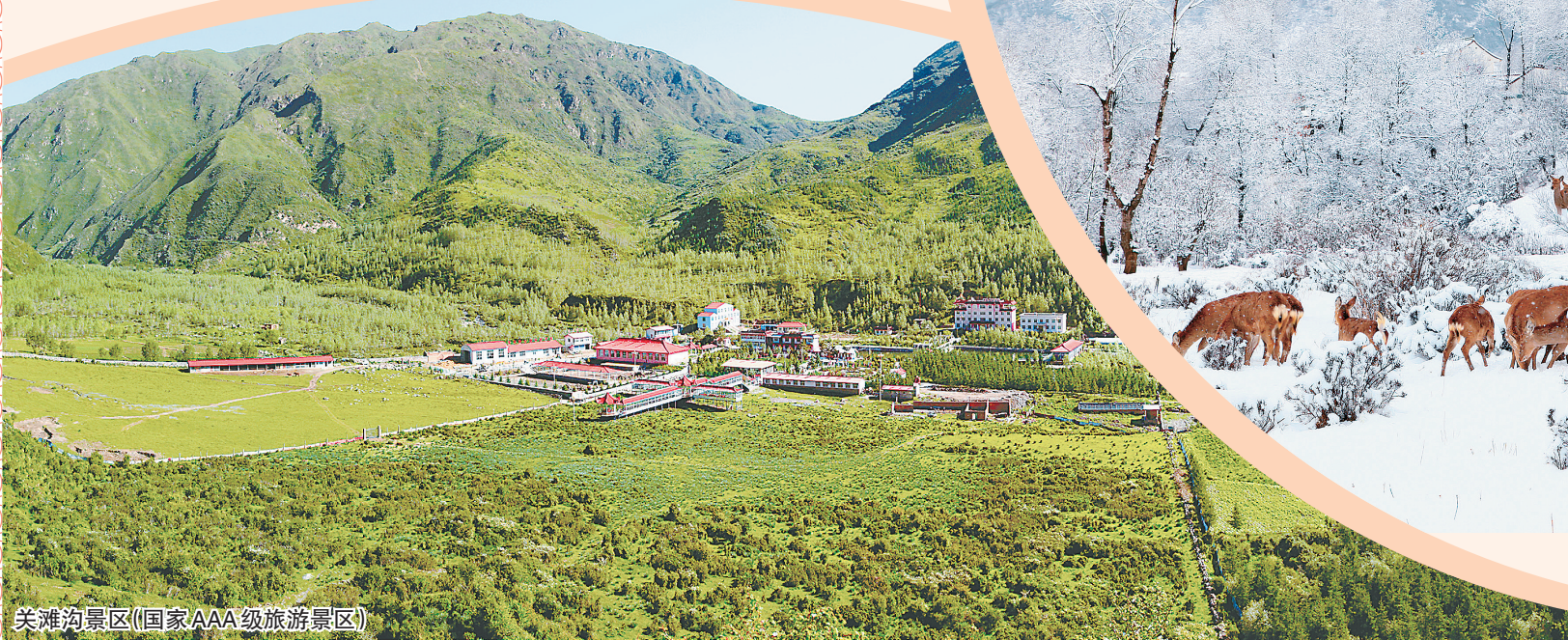
关滩沟景区(国家AAA级旅游景区)

好、产量高,在国内外市场享有盛誉。县域内有黄河、大夏河及其支流老鸦关河、漠泥沟河、红水河、牛津河、多支巴河和槐树关河等河流发源或流过,水资源相对丰富,全县总水量8.315亿立方米,可供用水量1.9亿立方米,水能蕴藏量达11.44万千瓦·时,开发水电站20座,装机总容量达3.5万千瓦。境内有堪称“河州珠穆朗玛峰”之称的五山池,河州八景之一的“露骨积雪”太子山,以及关滩沟、龙首山、莲花湖、三岔坪等诸多风景秀丽的景区,也有代表马家窑、齐家、辛店文化的杨家河、莲城、崔家、朱家墩等古文化遗址星罗棋布,旅游资源颇为丰富。