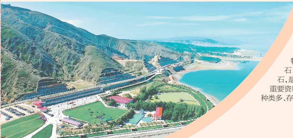
盛世旅游度假区(国家AAA级旅游景区)

东乡族自治县(东乡县)位于甘肃省中部西南面,临夏回族自治州东面,是我国东乡族相对集中居住的民族自治县。全县总人口38.17万人,其中东乡族33.55万人,占全县总人口的87.9%;县域总面积1510平方公里,海拔1735~2664米。