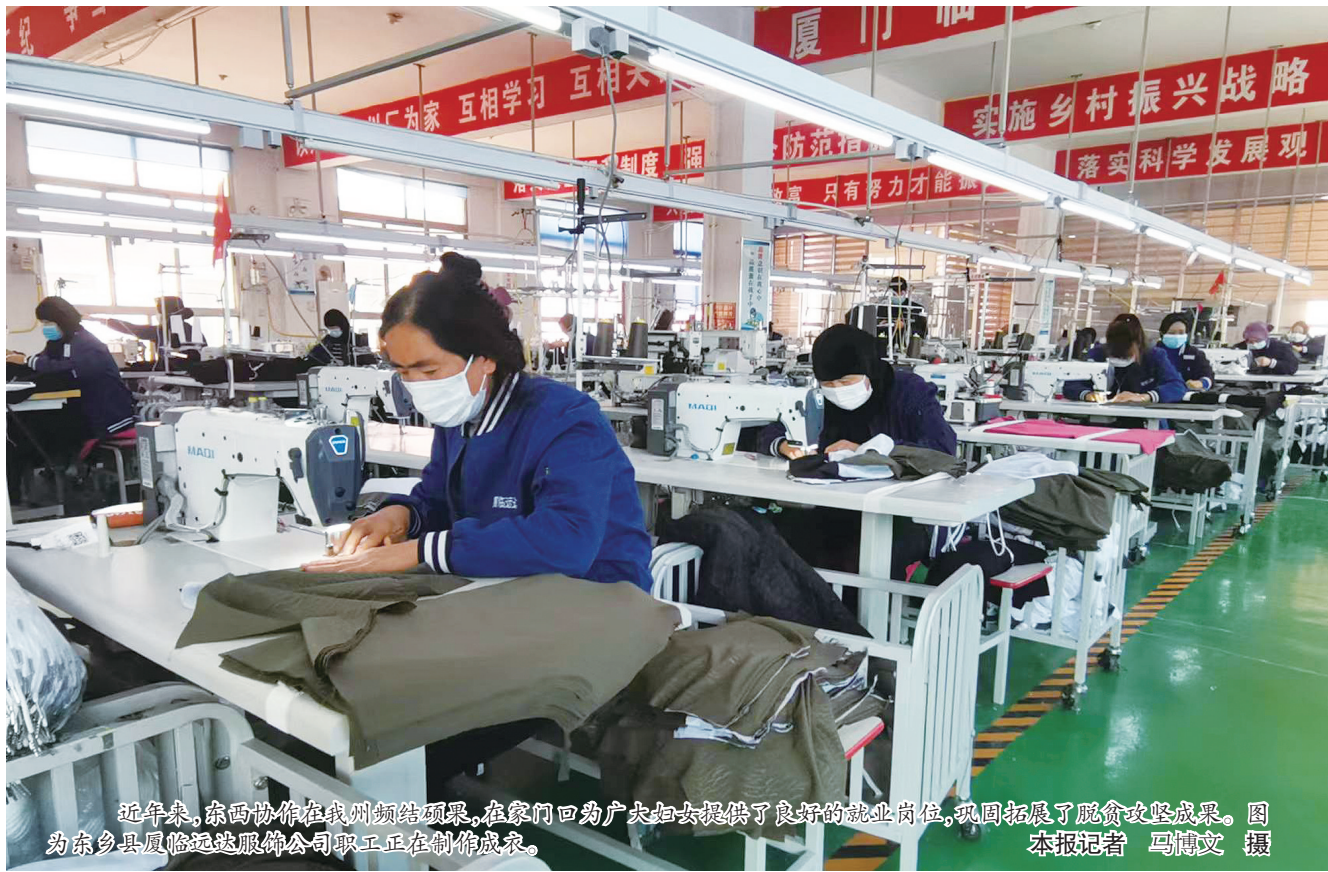
近年来,东西协作在我州结硕果,在寨门口为广大妇女提供了良好的就业岗位,巩固拓展了脱贫攻坚成果。图为东乡县真临缝衣厂女工正在制作成衣。