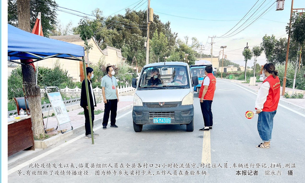
此轮疫情发生以来,临夏县组织人员在全县各村口24小时轮流值守,对过往人员、车辆进行登记、扫码、测温等,有效阻断了疫情传播途径。图为桥寺乡大梁村卡点,工作人员在查验车辆。

百盛超市天元店等商超也推出“线上+线下”服务,积极协调货源,增派分拣、配送人手,全力满足市民消费需求。同时,在配送过程中,各企业对配送工具进行全面消毒,要求配送员佩戴口罩、手套,进行“无接触式”配送,确保市民群众买到放心、安全的食品。